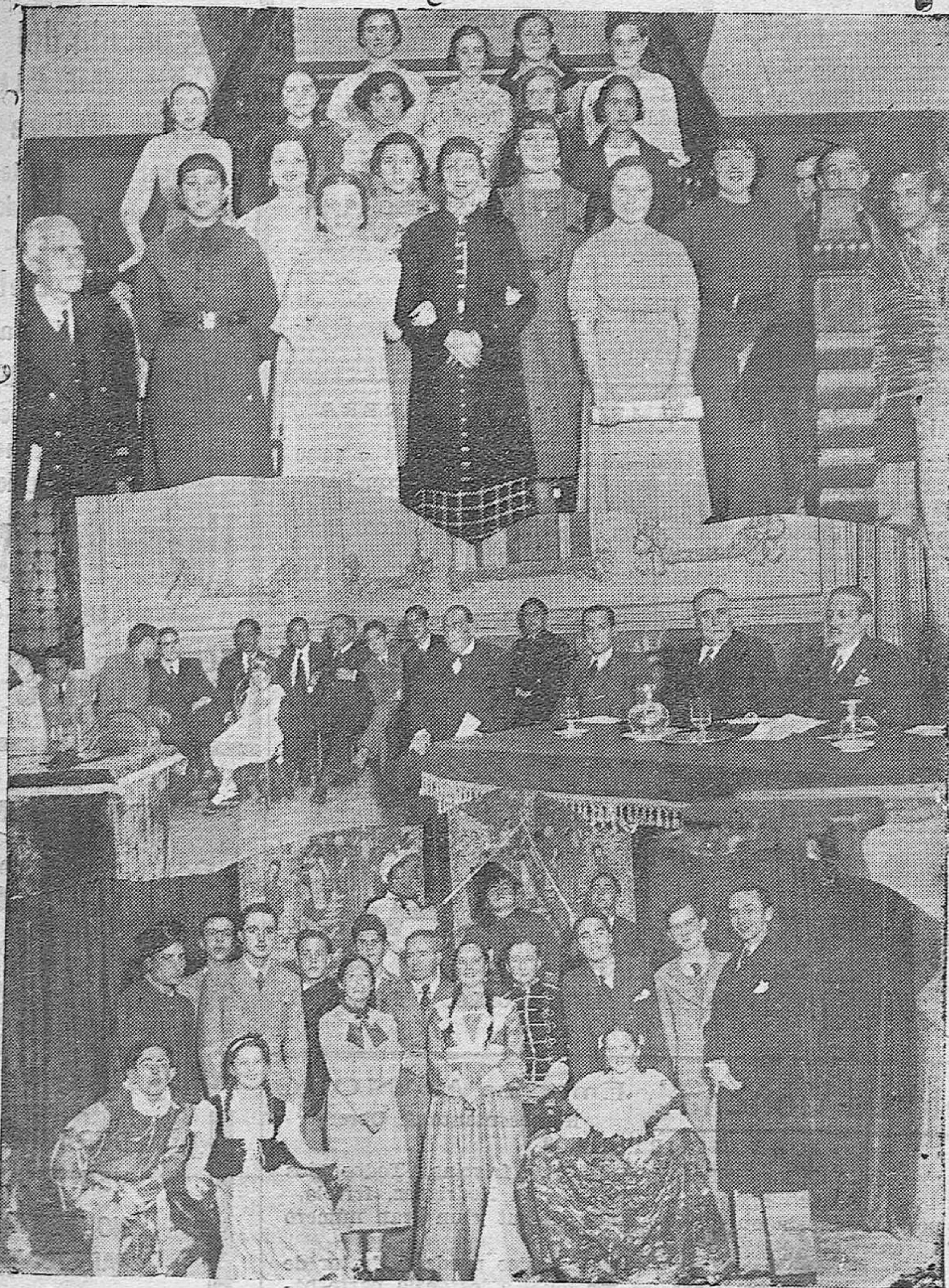
Varios detalles de los actos celebrados en el Circulo de la Amistad y en el Instituto Nacional de Segunda Enseñanza para conmemorar el Tercer Centenario de Lope de Vega.