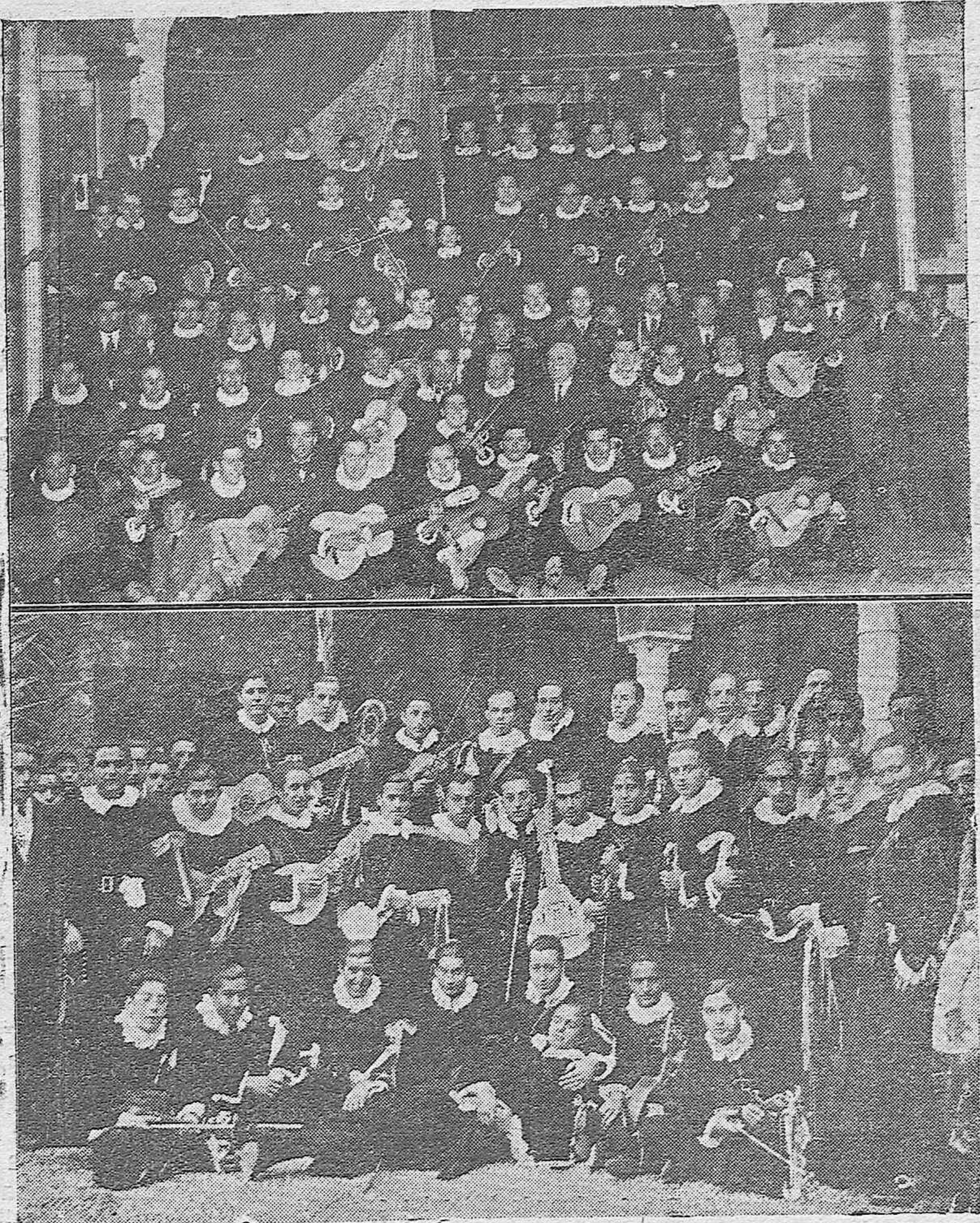
Arriba: El "Centro Filarmónico de Espejo" con su Junta Directiva que ha visitado nuestra capital.—Abajo: Estudiantes que forman la "Tuna Universitaria Murciana", que estuvieron en la redacción de LA VOZ con motivo de su estancia en Córdoba.