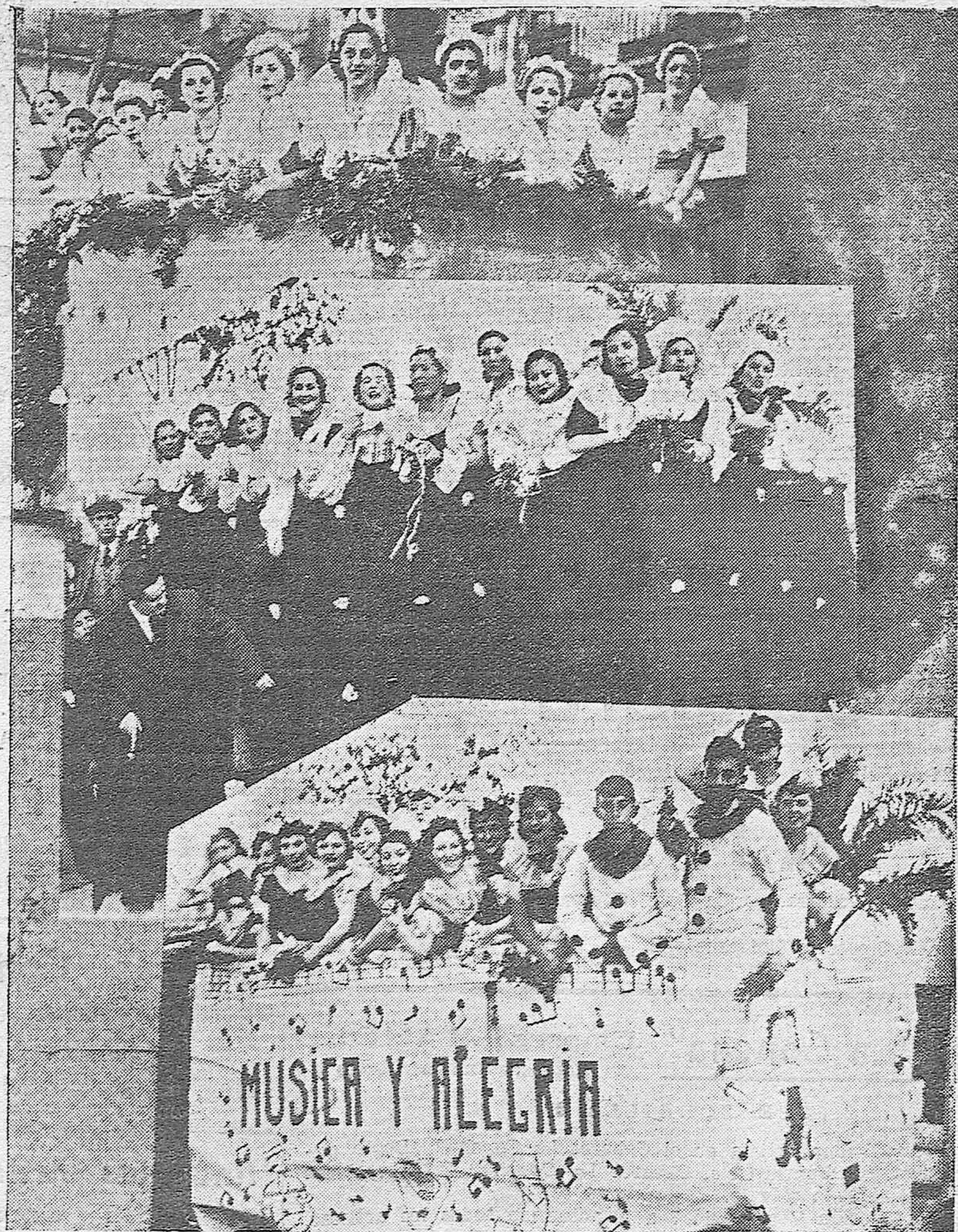
LAS FIESTAS DEL CARNAVAL

Bellas muchachas ocupando carrozas, durante el desfile por el Paseo de la Victoria, donde se celebró el Carnaval