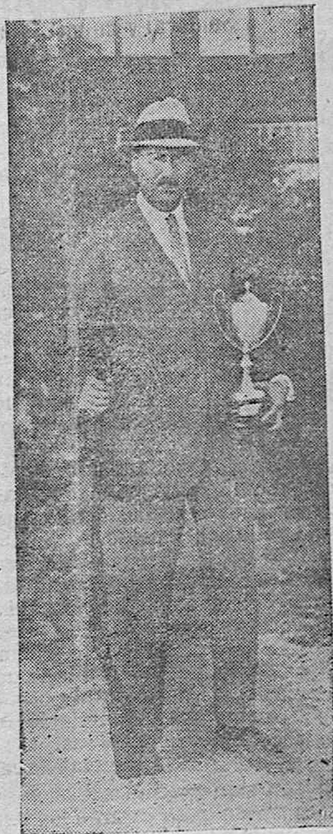
EL MARQUÉS DE SANTURCE, GANADOR DE LA COPA DEL AYUNTAMIENTO EN EL TIRO DE PICHÓN.

Visita EL METRO que vende sus artículos a precios bajos y no hay quien pueda igualarle en precios y surtido.