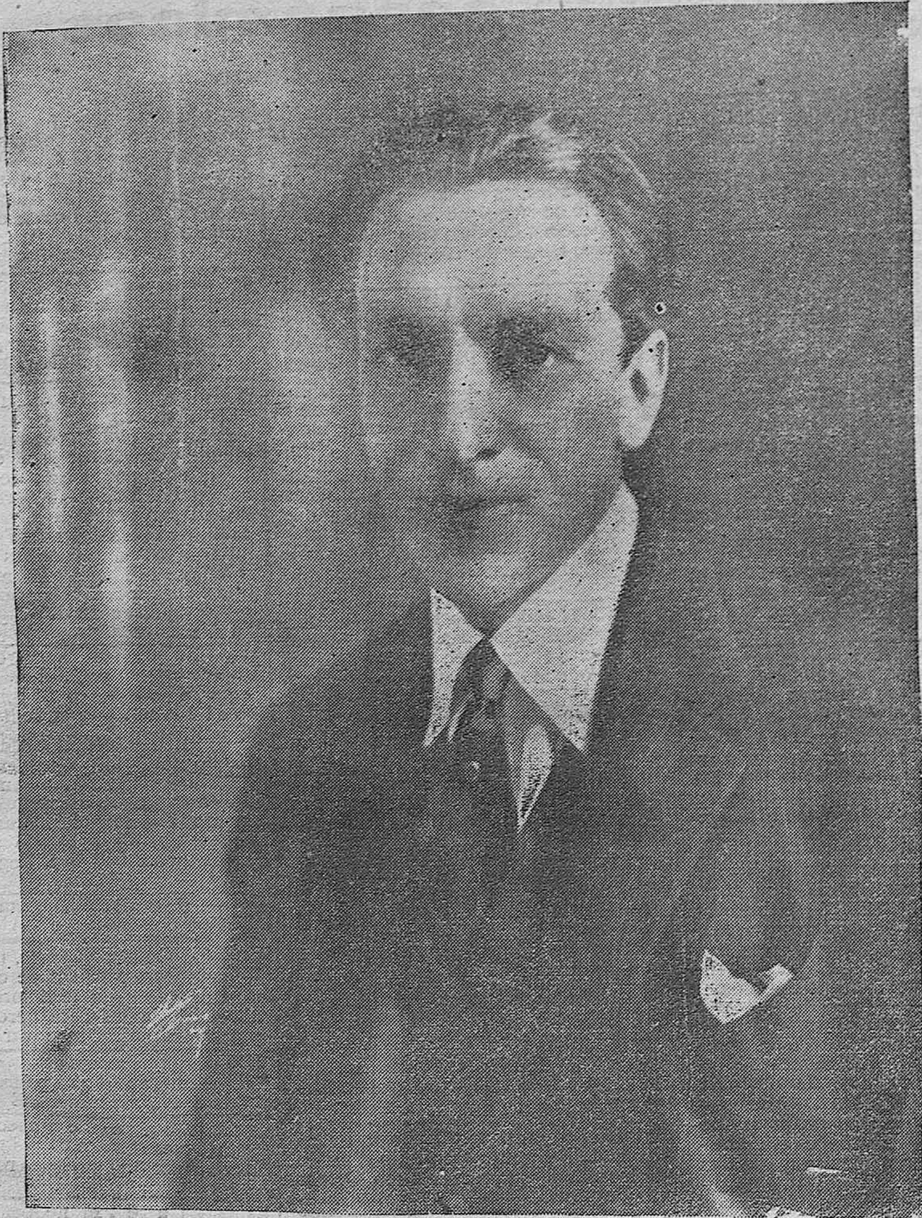
PEDRO DE CÓRDOBA, NOTABLE ARTISTA CINEMATOGRAFICO QUE ACTUALMENTE SE HALLA EN NUESTRA CAPITAL, IMPRESIONANDO UNA CINTA DE COSTUMBRES ESPAÑOLAS.