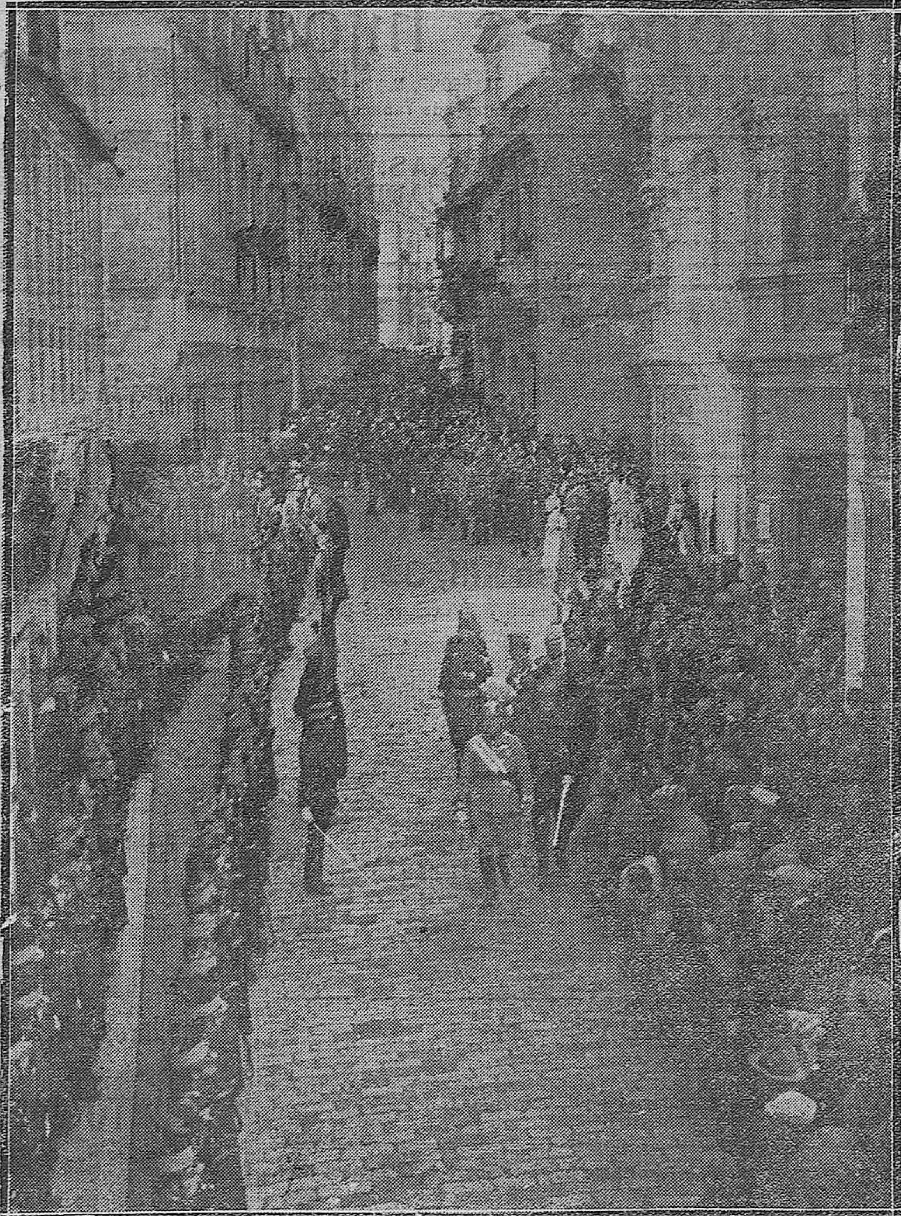
EL ACTO PATRIÓTICO DE AYER.--Aspecto que ofrecía la calle Alfonso XIII momentos antes de comenzar la recepción celebrada en el Gobierno Civil.