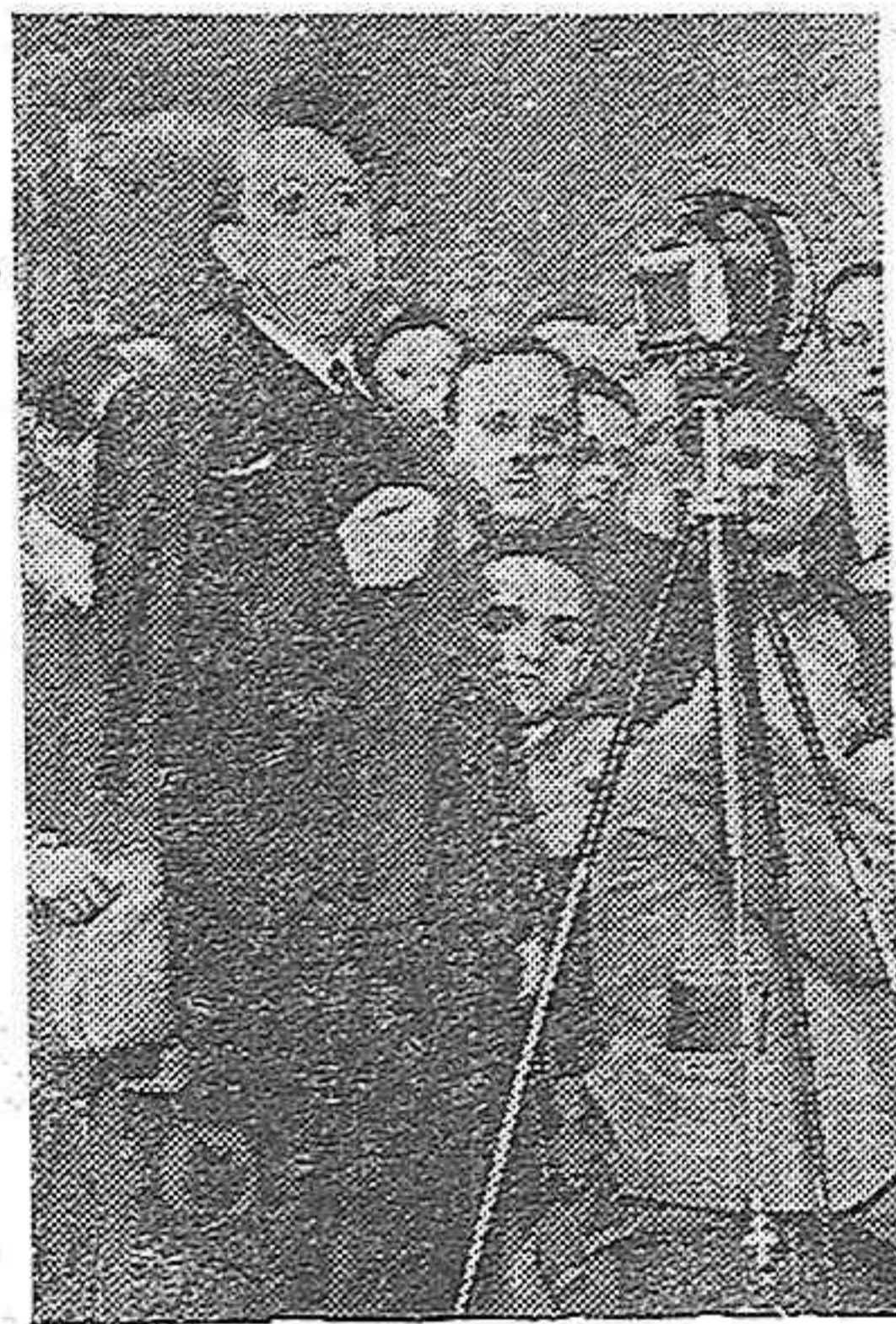
El señor Gil Robles, en el Gran Teatro, dirigiendo la palabra al público

bierno, contando con el Parlamento. Se dijo que, siendo nosotros la fracción más numerosa parlamentaria, éramos sospechosos de desafectos al régimen. Y yo digo que, cuando un partido como el nuestro declara servir a un régimen sinceramente, para servir también sinceramente a una nación, no hay derecho a dudar de él. Éramos un partido nuevo, en sus componentes y en su historia. Un partido en que los hombres no habían ostentado cargos, ni habían disfrutado sinecuras. ¿Por qué ese recelo? Era, sin duda, que recelaban de nosotros los que se miraban a sí mismos. (Risas).