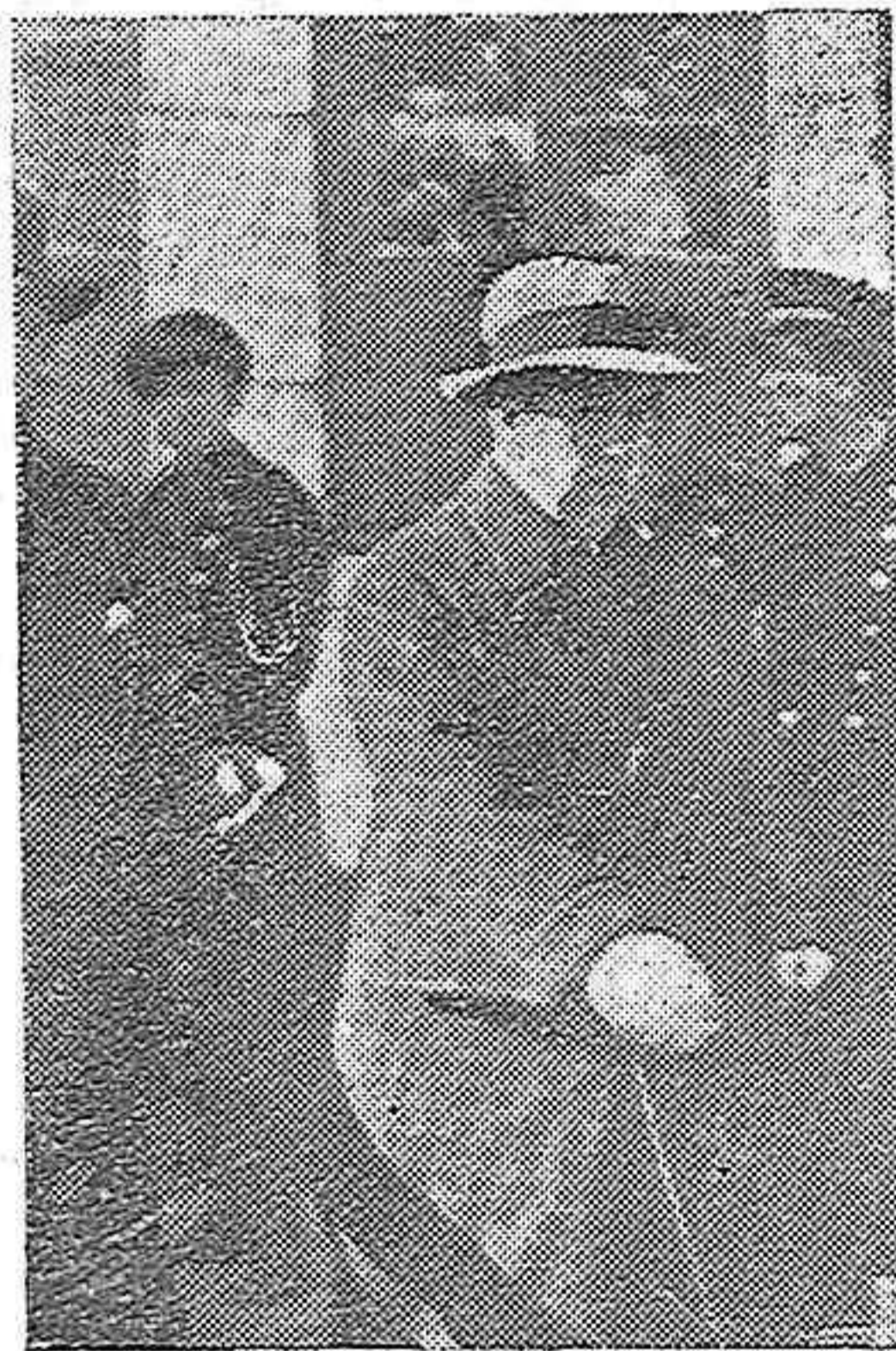
El señor Gil Robles sale del Gran Teatro para continuar su discurso en el Duque de Rivas

Recuerda con cifras la intensidad de este problema en los Estados Unidos, en Alemania y en Inglaterra, y dice que si bien es verdad que en