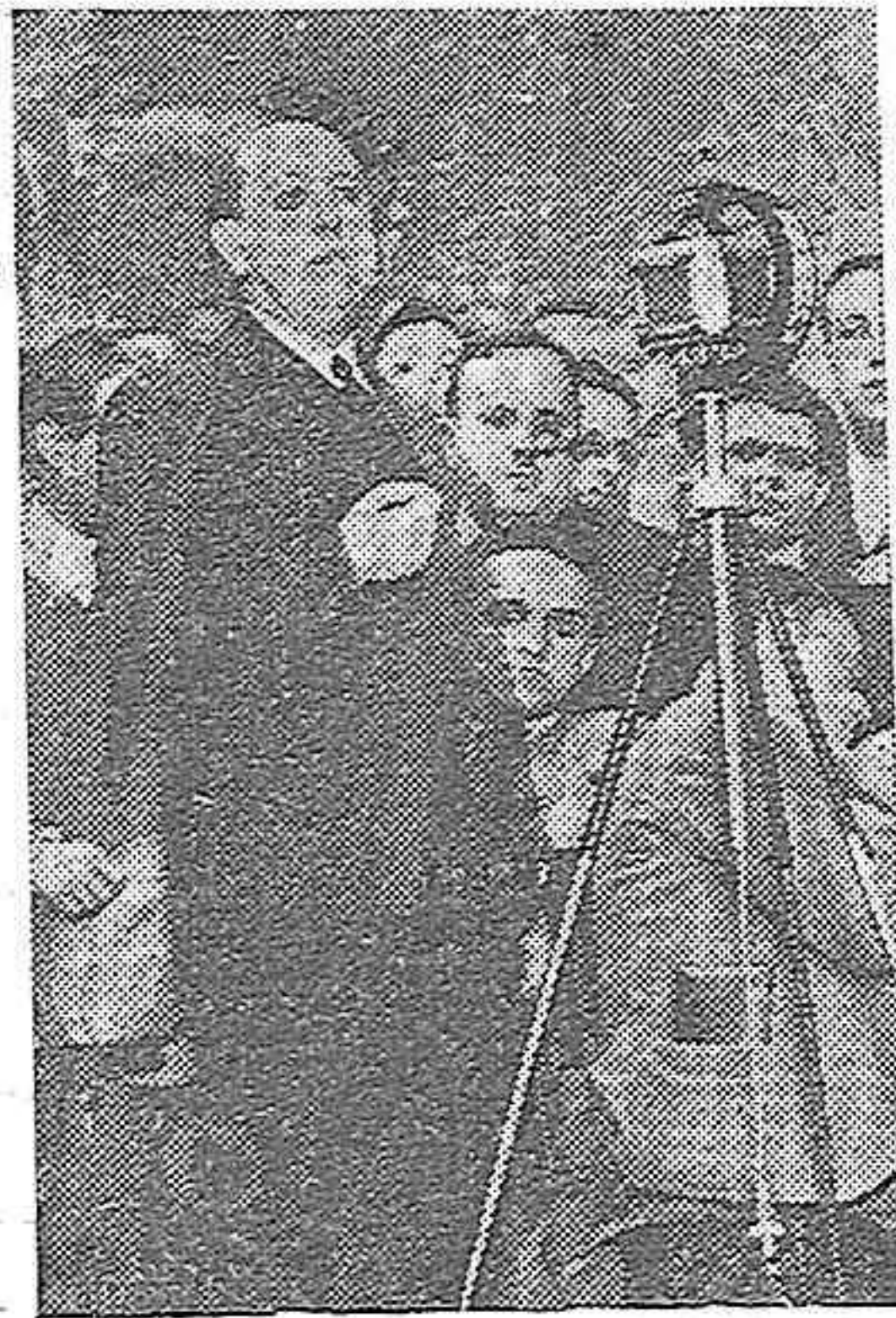
El señor Gil Robles, en el Gran Teatro, dirigiendo la palabra al público

bierno, contando con el Parlamento. Se dijo que, siendo nosotros la fracción más numerosa parlamentaria, éramos sospechosos de desafectos al régimen. Y yo digo que, cuando un partido como el nuestro declara servir a un régimen sinceramente, para servir también sinceramente a una nación, no hay derecho a dudar de él. Éramos un partido nuevo, en sus componentes y en su historia. Un partido en que los hombres no habían ostentado cargos, ni habían disfrutado sinecuras. ¿Por qué ese recelo? Era, sin duda, que recelaban de nosotros los que se miraban a sí mismos. (Risas).