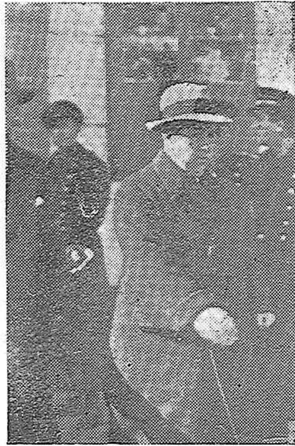
El señor Gil Robles sale del Gran Teatro para continuar su discurso en el Duque de Rivas

Recuerda con cifras la intensidad de este problema en los Estados Unidos, en Alemania y en Inglaterra, y dice que si bien es verdad que en