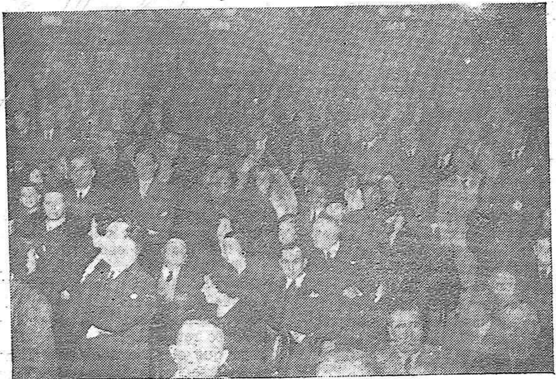
Aspecto parcial de la Sala del Gran Teatro durante el acto.

El Presidente de la República, llevado de un odio intenso, abacó al