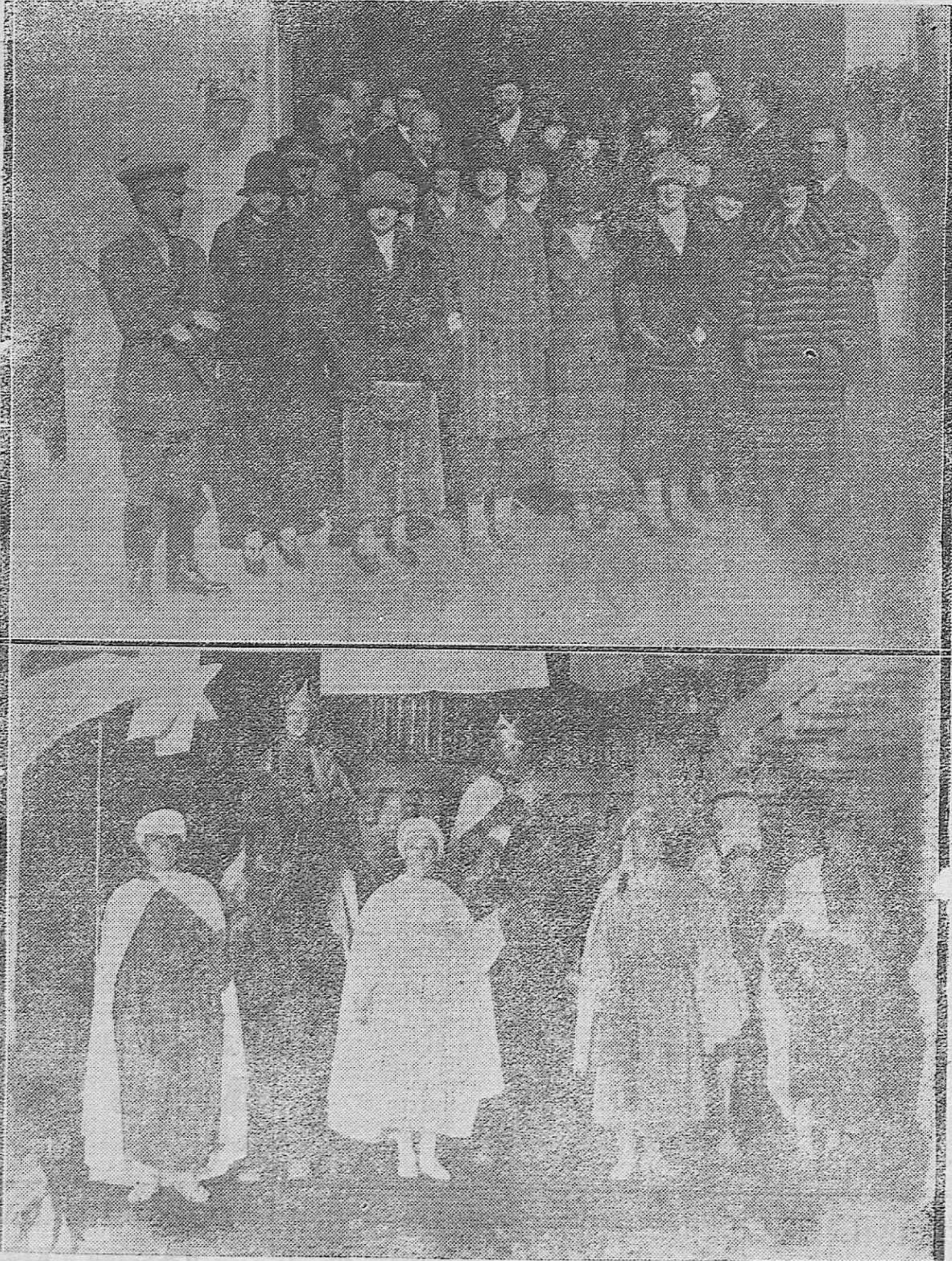
1) El alcalde, concejales, diputados y damas, visitantes del soldado, que ayer reparieron el aguinaldo en el Hospital Militar.—2) Los Reyes Magos en el patio de la típica posada del Potro, de donde salieron.