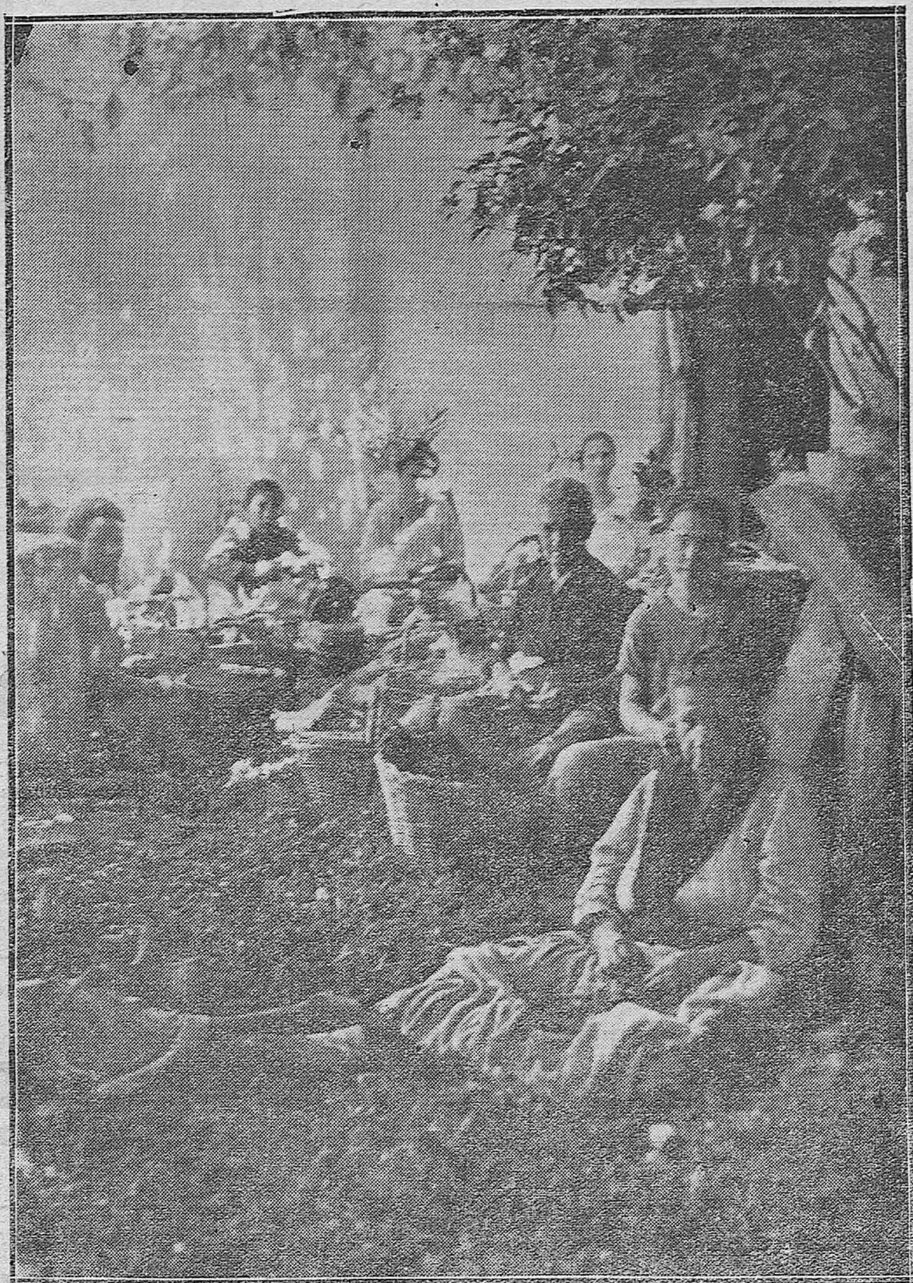
ESCENAS DE LA VIDA CORDOBESA.—LAS TIPICAS AVELLANERAS LLUVIANDO EL FRUTO EN UN CASTIZO PATIO DE SAN JUAN DE LERMA