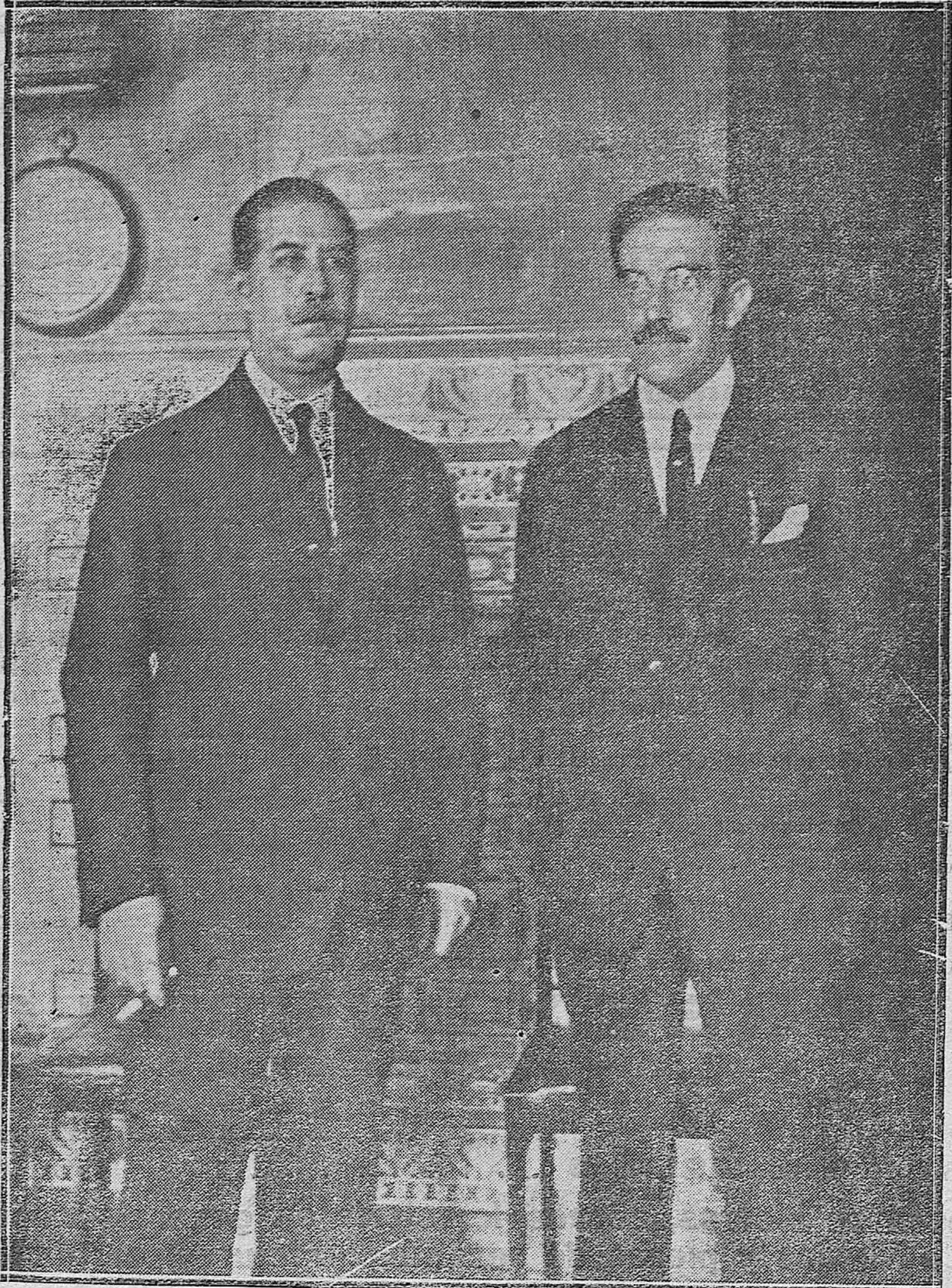
EL GOBERNADOR MILITAR HACIENDO ENTREGA AL PRESIDENTE DE LA AUDIENCIA DEL MANDO DE LA PROVINCIA