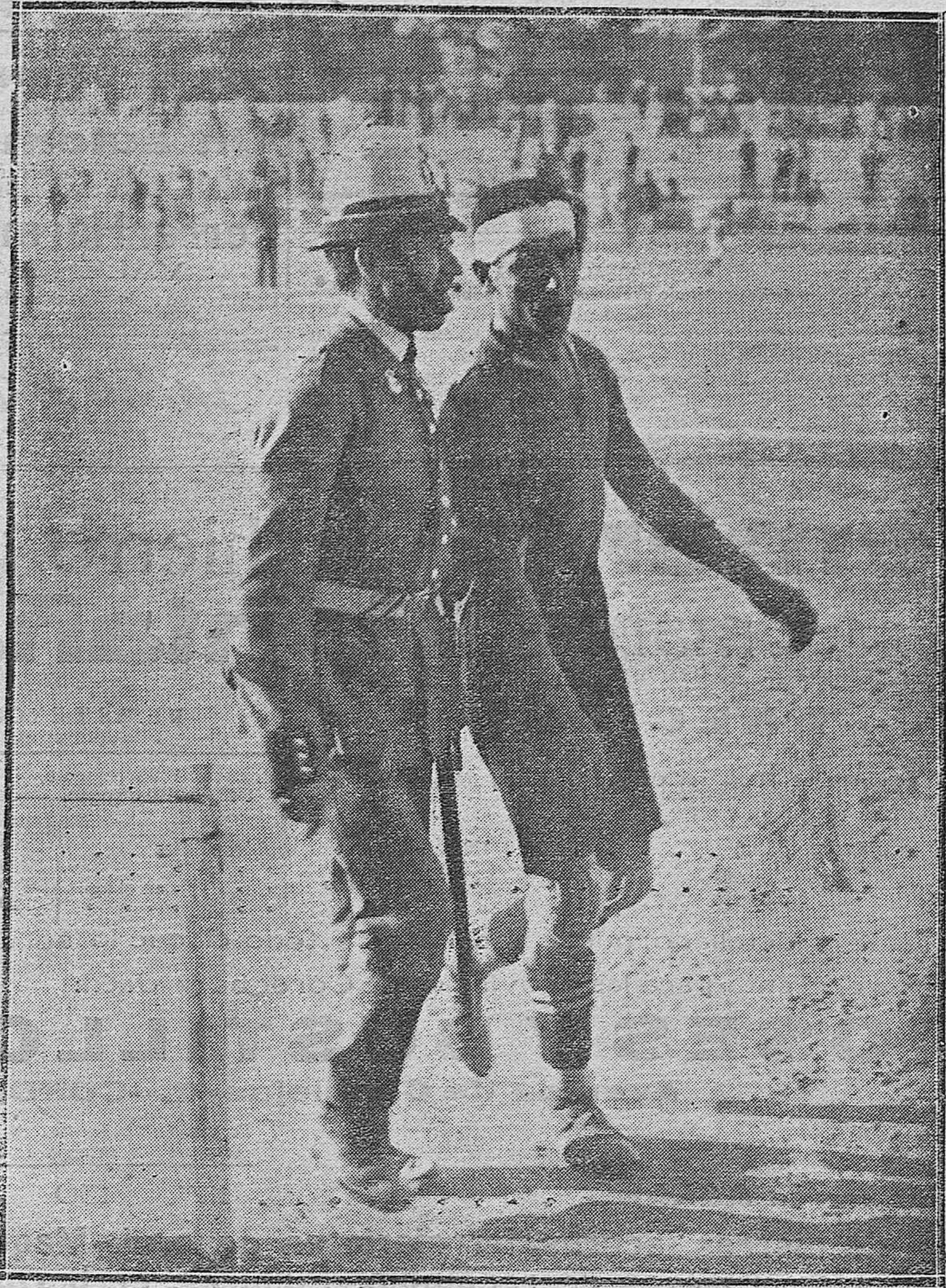
EN EL STADIUM AMERICA.--DETECCION DE UNO DE LOS JUGADORES DEL "CORDOBA F. C" QUE EN UN MOMENTO DE IRRITACION ARROJÓ UNA PIEDRA AL PÚBLICO.