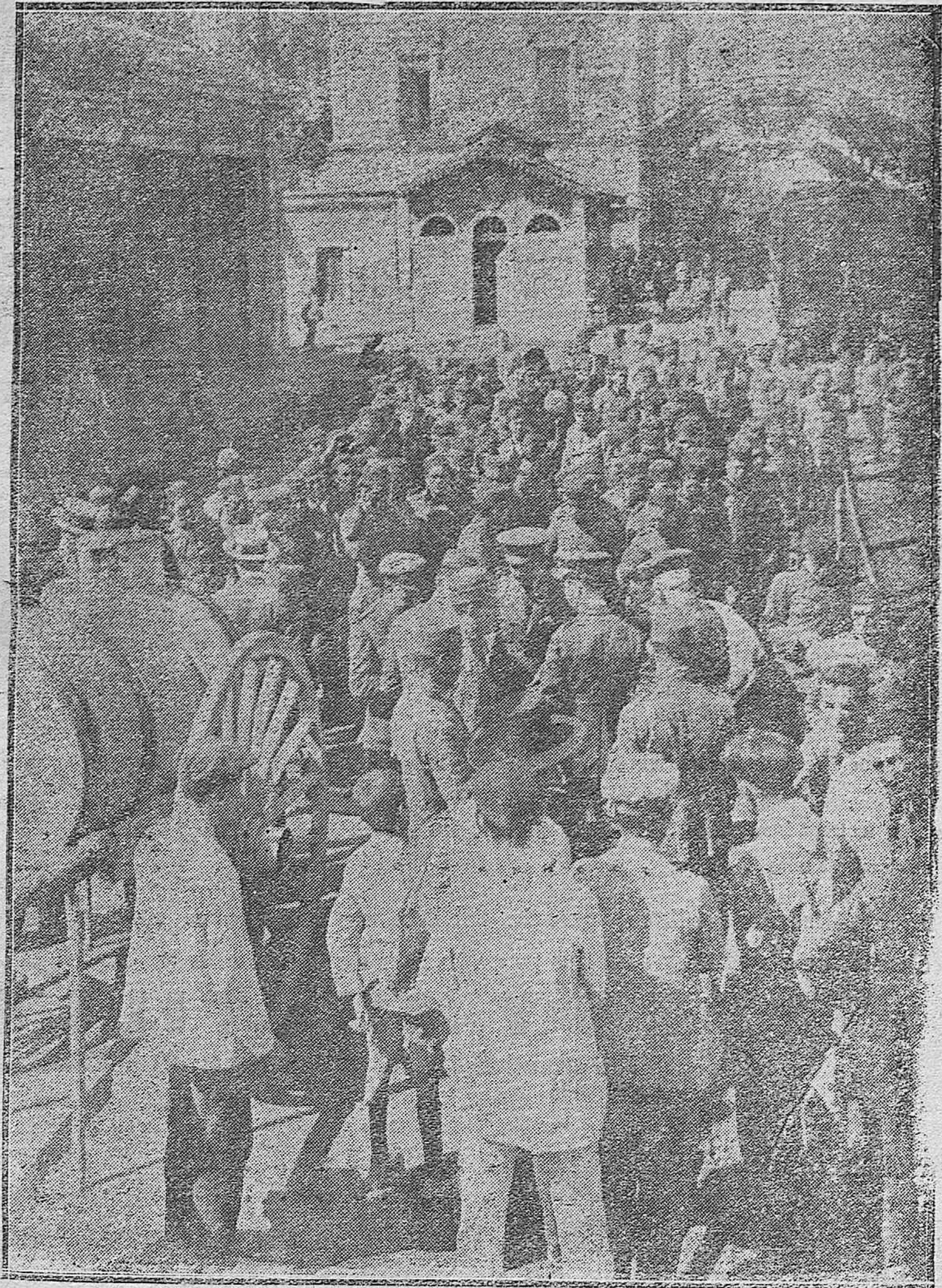
PASO DE TROPAS PARA MARRUECOS.—ASPECTO DE LA ESTACIÓN CENTRAL EN LA MAÑANA DE ESTE DÍA DURANTE LA ESTANCIA DE LOS SOLDADOS DE SIGÜENZA.