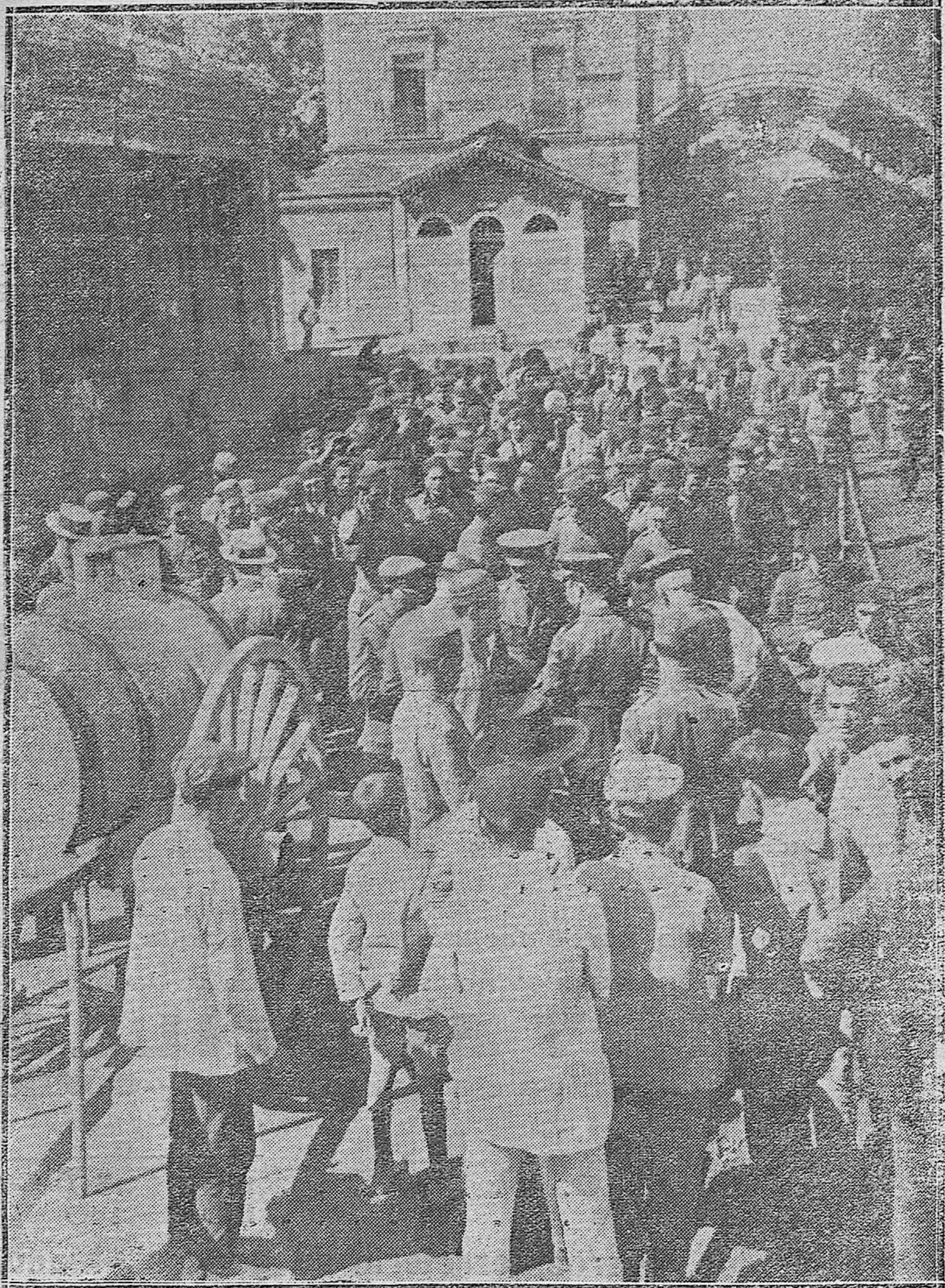
PASO DE TROPAS PARA MARRUECOS.—ASPECTO DE LA ESTACIÓN CENTRAL EN LA MAÑANA DE HOY DURANTE LA ESTANCIA DE LOS SOLDADOS DE SICILIA