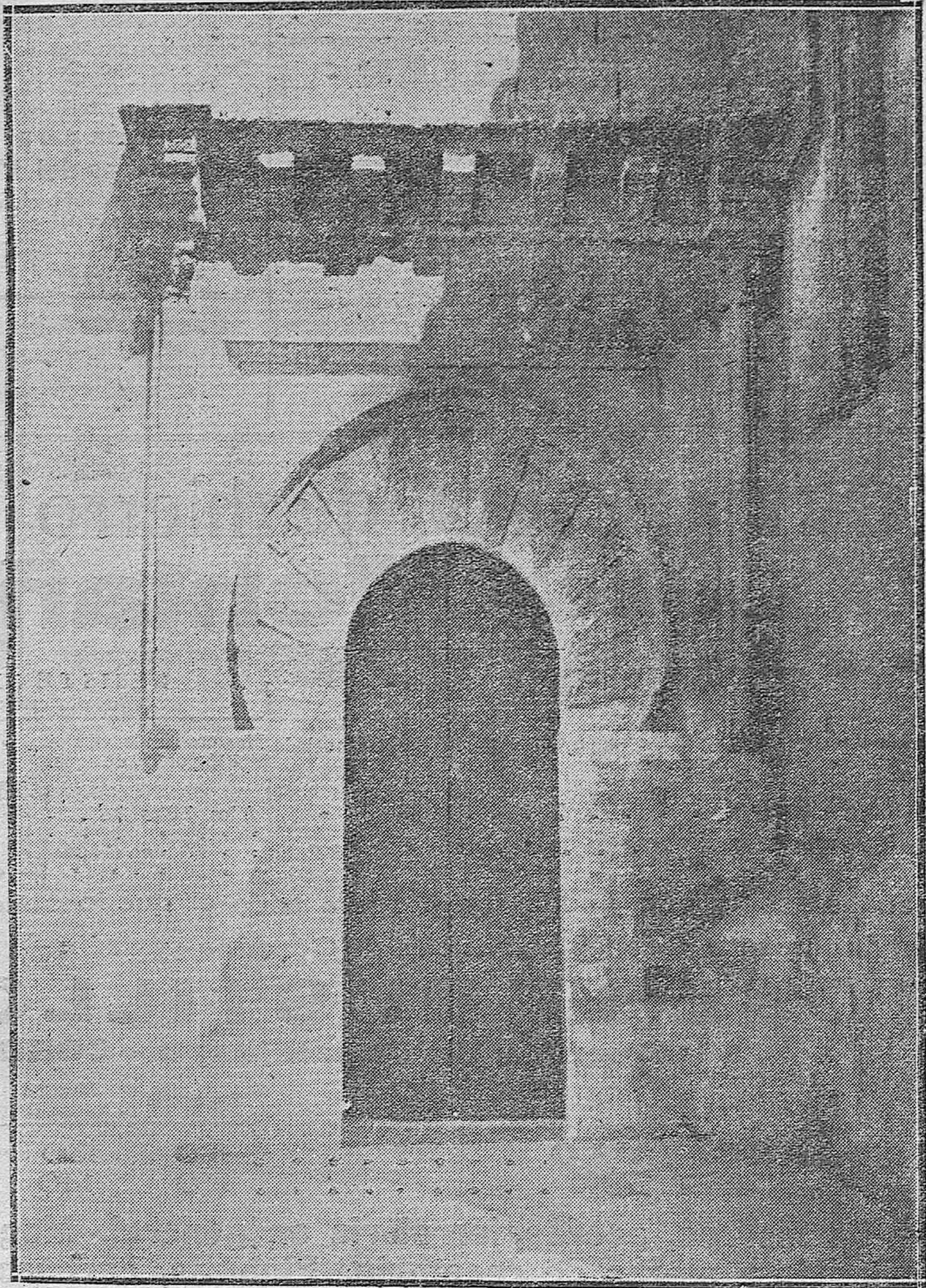
PORTADA DE LA IGLESIA DE SAN MIGUEL, DE EXTRAORDINARIA BELLEZA Y PURO ESTILO.