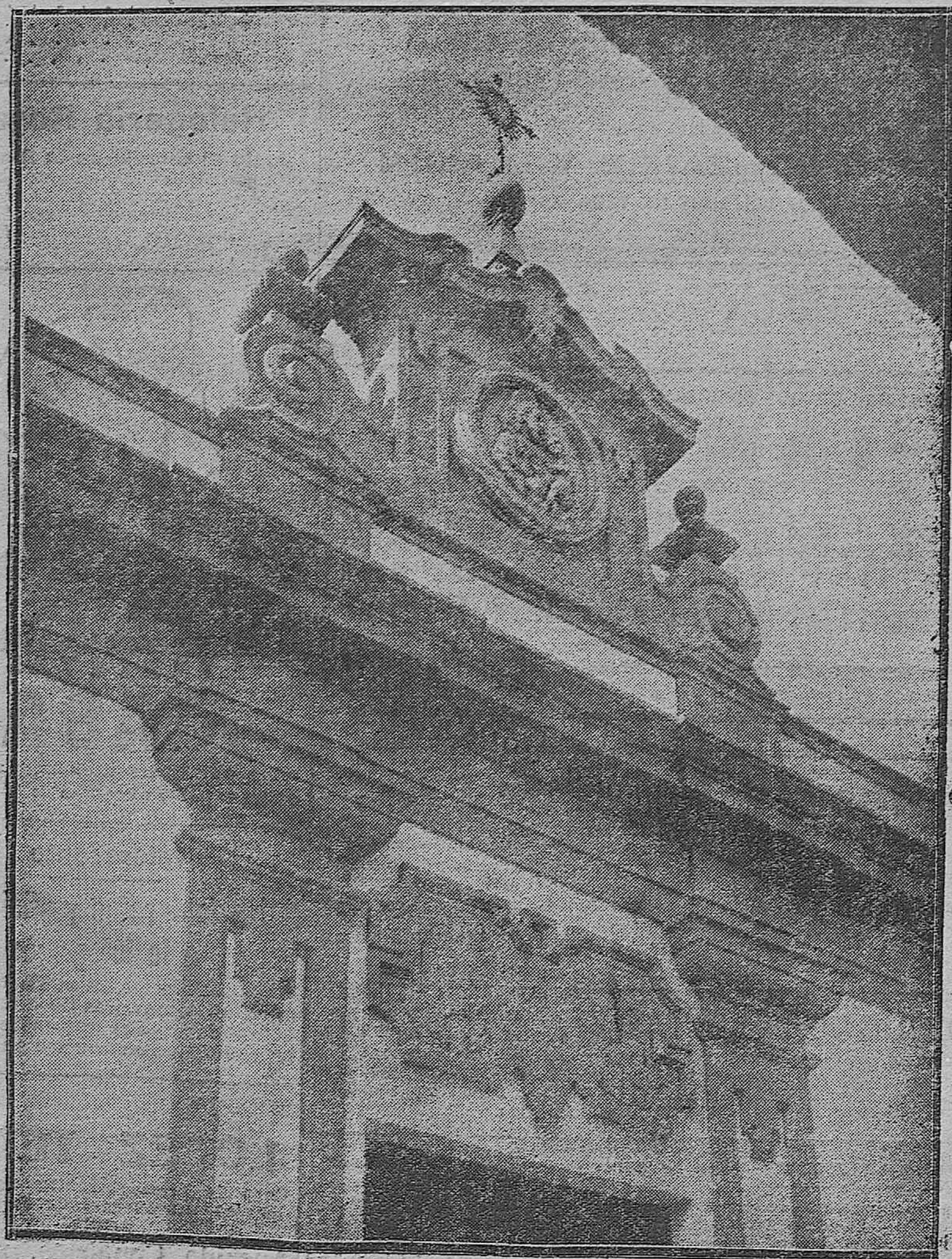
Detalle ornamental de la fachada del Asilo para niños, denominado de San José, que pronto será inaugurado en la calle de Jesús Nazareno.