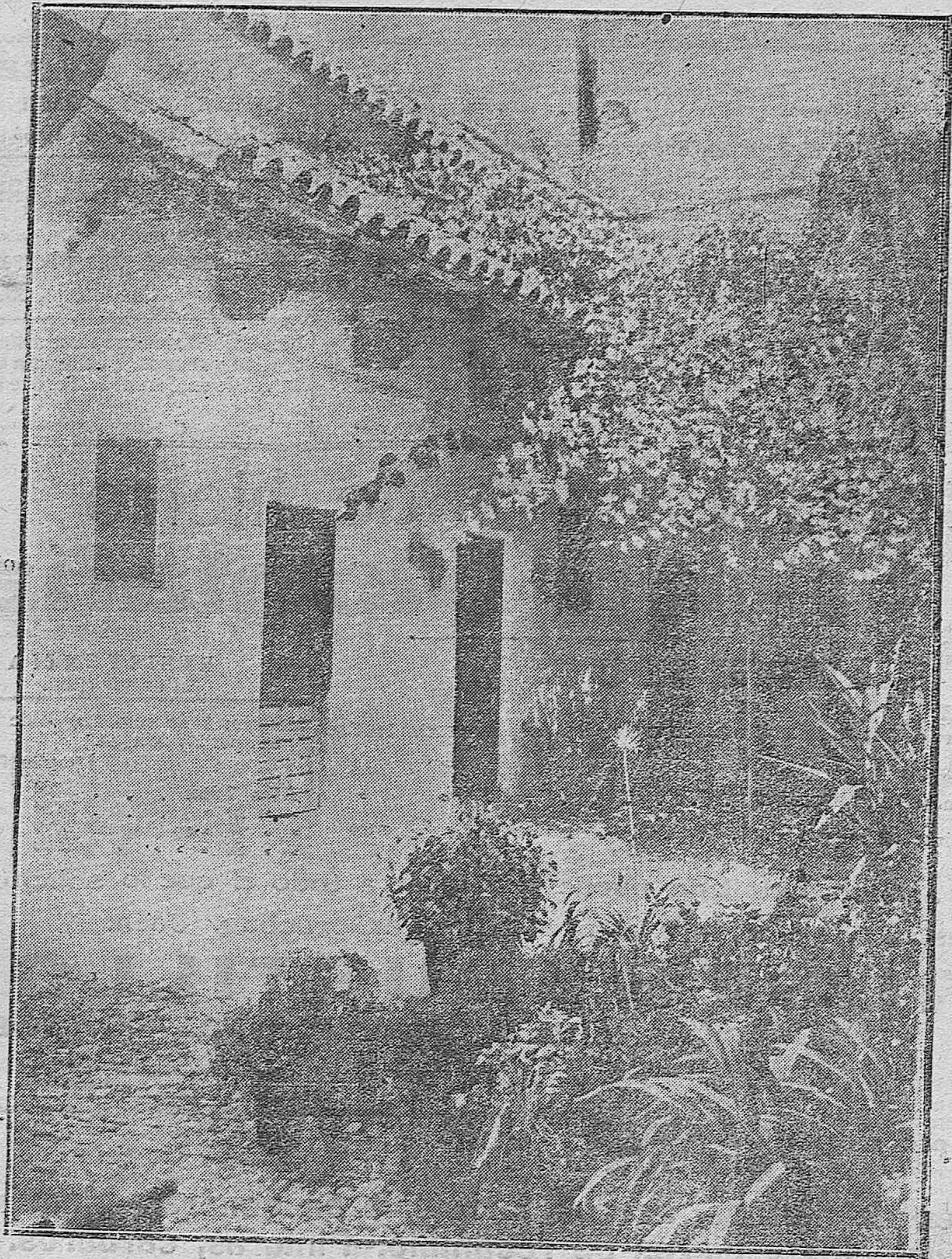
[BELLO RINCÓN DE UN PATIO CORDOBÉS DE UNA CASA DE VECINOS.