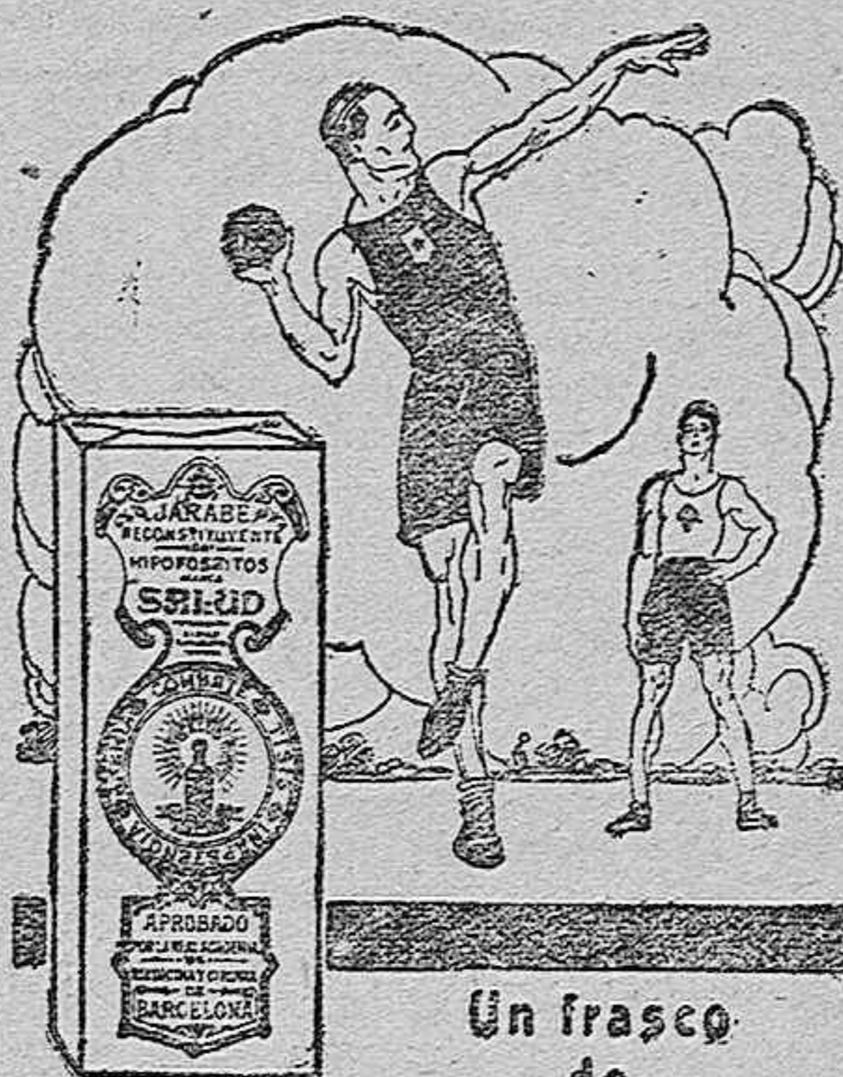
Un frasco de

Tan pronto como averiguemos datos concretos, los haremos del dominio de nuestros lectores.