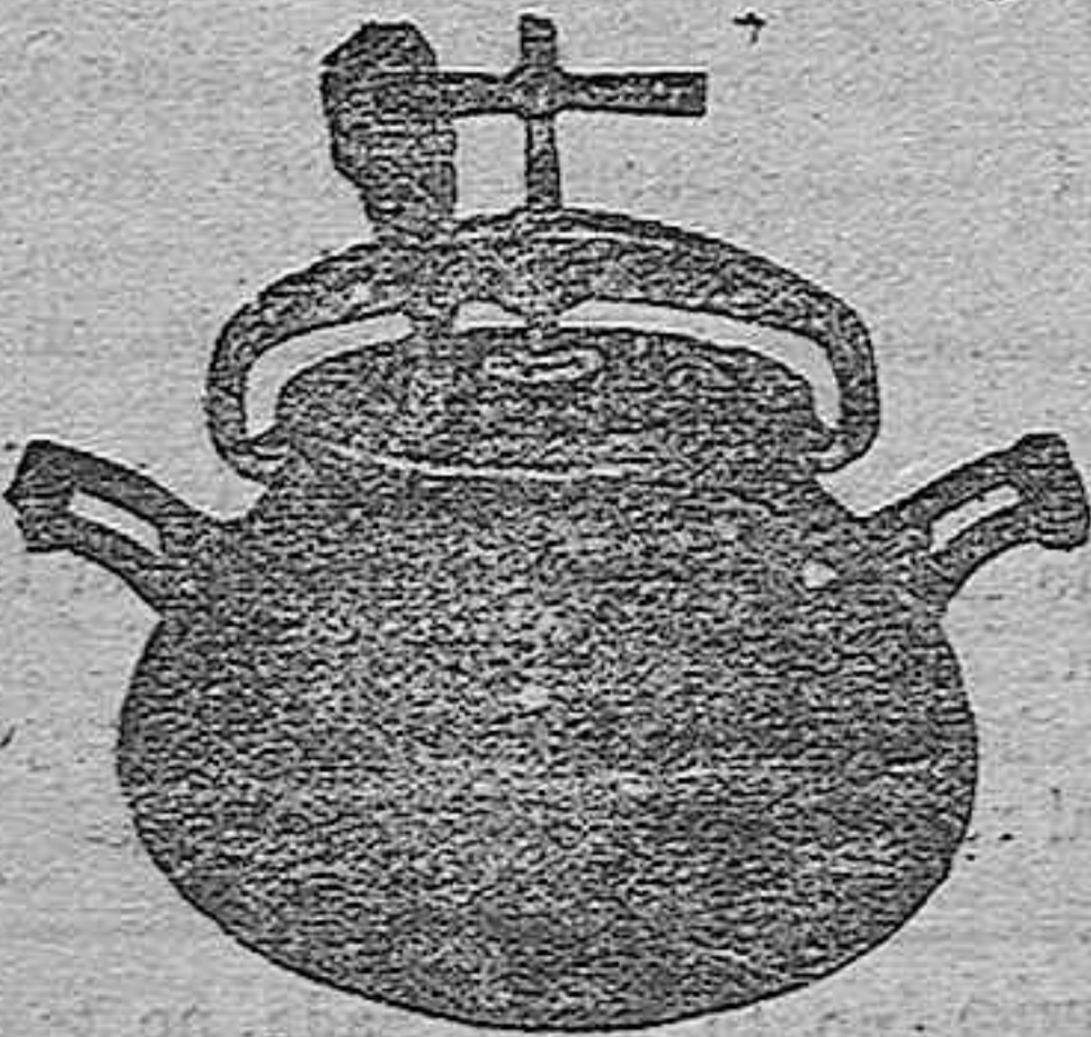
Marmita Hispano-Olla Expres

Batería de cocina - Herrajes para obras y herramientas en general