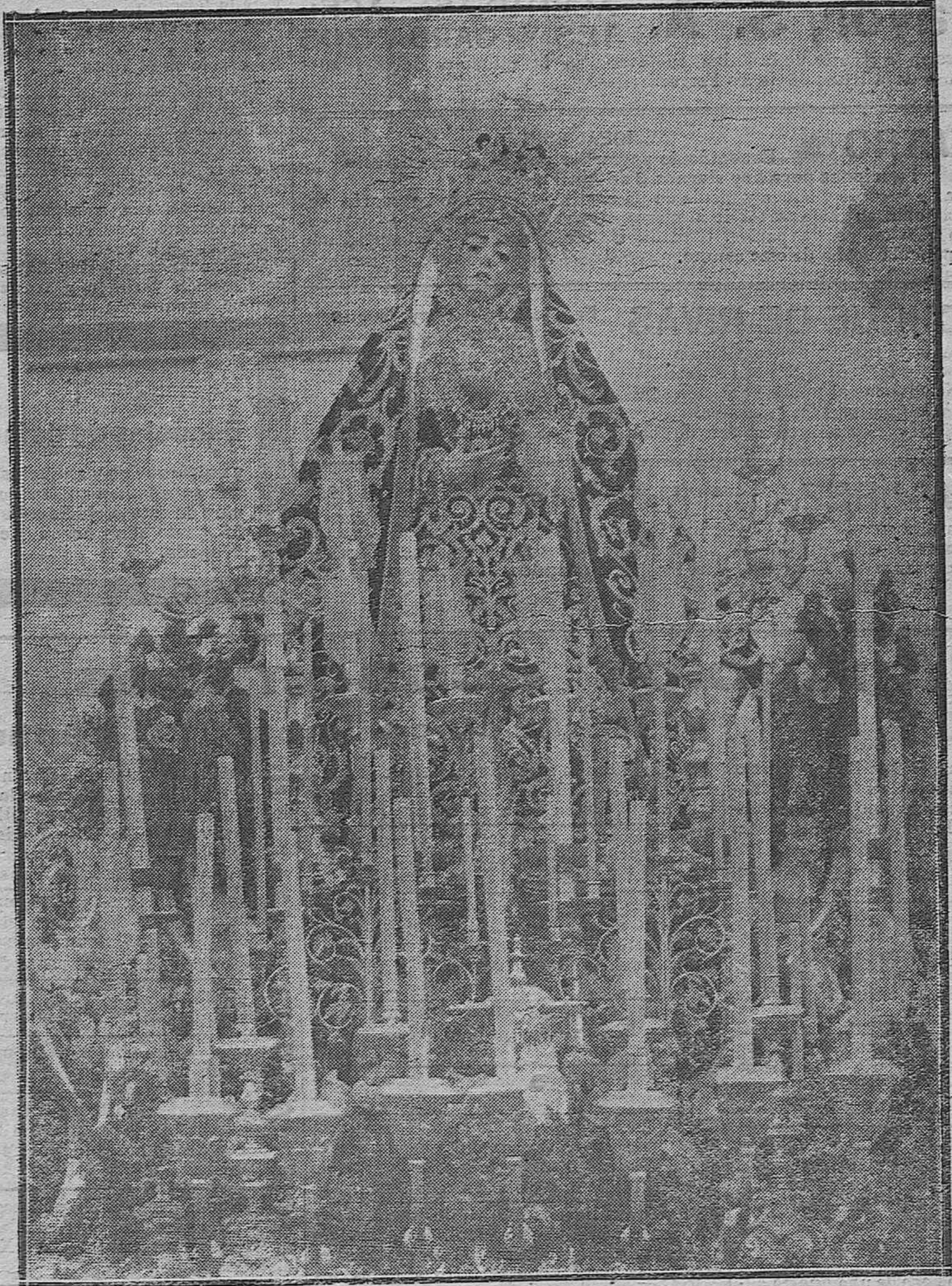
Imagen de Nuestra Señora de los Dolores, que el vecindario cordobés venera en la iglesia del hospital de San Jacinto, situado en la plaza de Capuchinos.