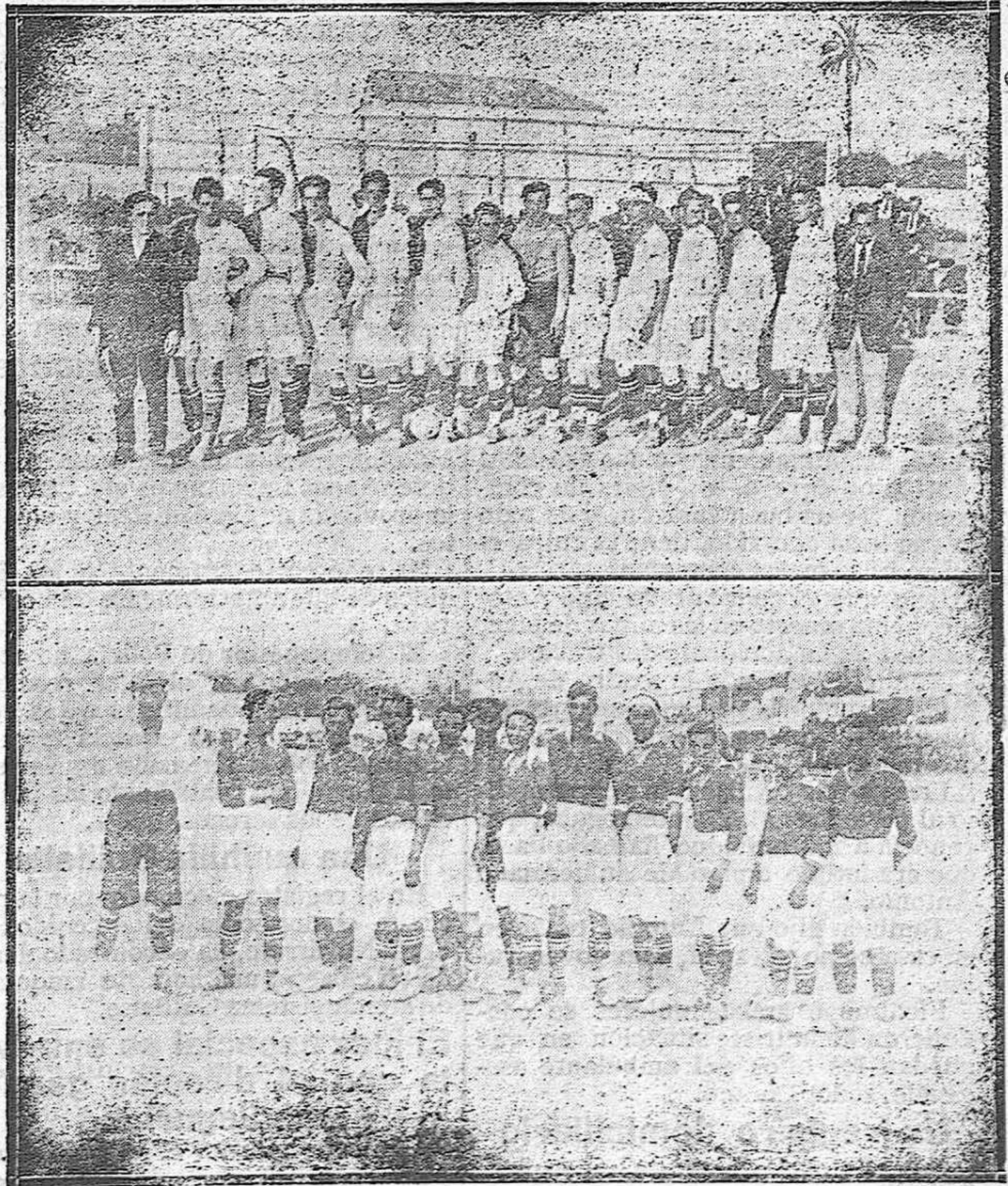
LOS EQUIPOS DE FUTBOL "SPORTING DE MADRID," Y "CÓRDOBA SPOPTING CLUB," QUE HAN CONTENTIDO EN EL "STADIUM AMÉRICA", RESULTANDO VENCEDOR EL LOCAL, POR CINCO TANTOS A DOS.