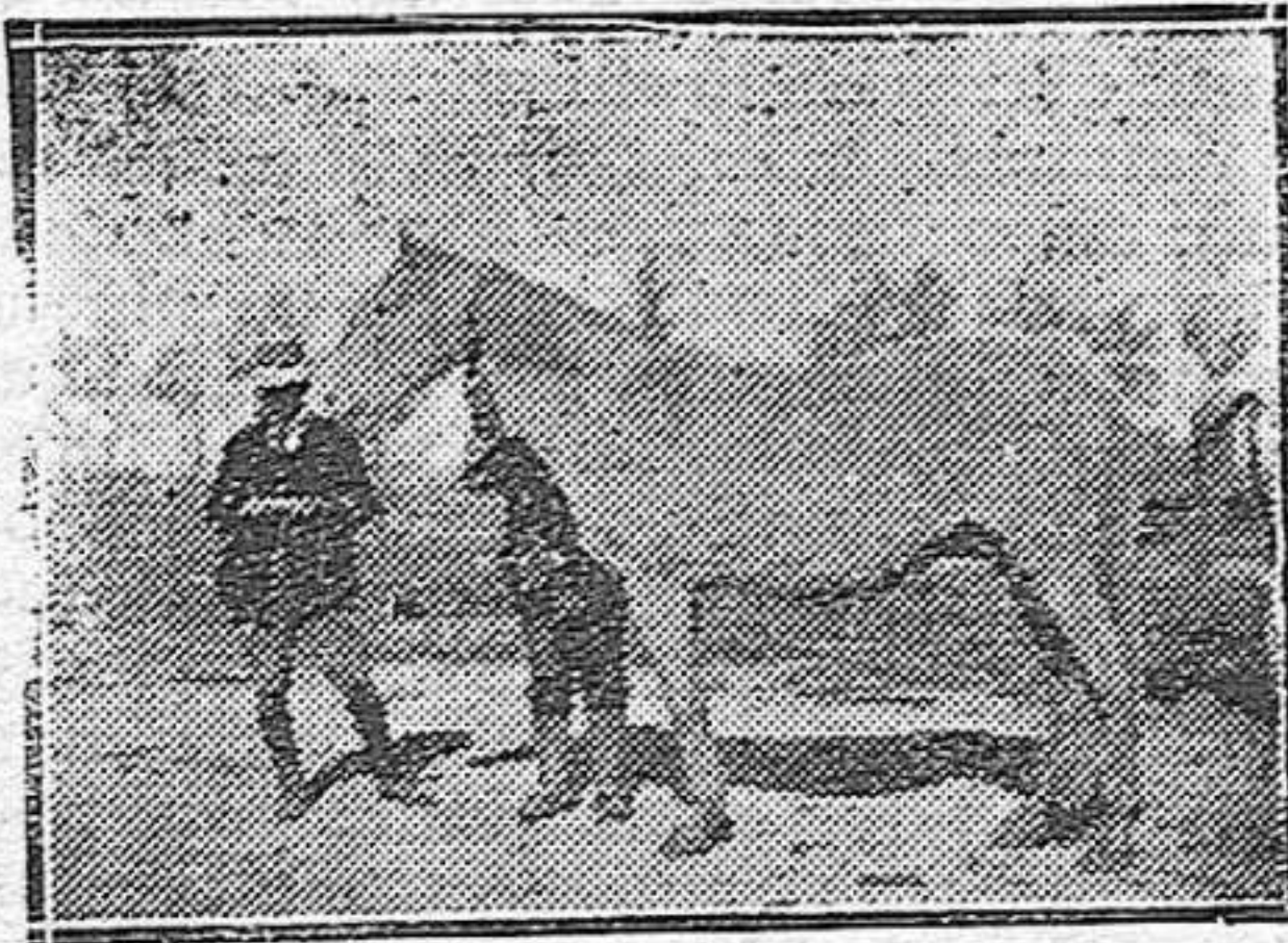
HERMOSO EJEMPLAR DE RAZA CABALLAR ANDALUZA.

—Las gallinas necesitan casi todo el año su ración de verde. Si se vé que no la consumen rápidamente, se cortan las yerbas u hortalizas en pequeños trozos, sirviendoselas en comederos.