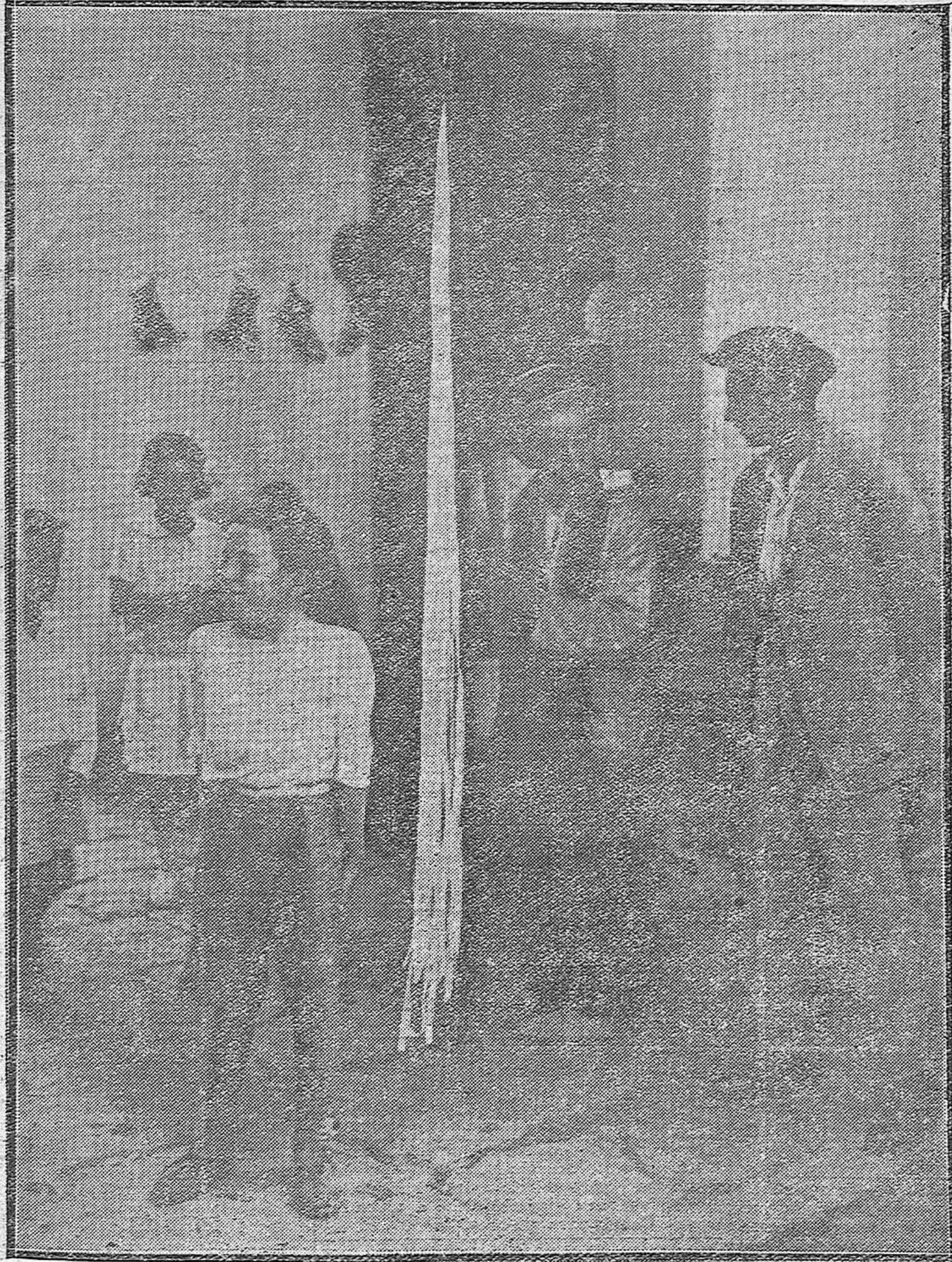
TIPOS POPULARES CORDOBESES.--El conocidísimo "Tio Miseria" que de manera tan original expone su mercancía a las mocitas que pasan por la calleja del Toril a las horas de mercado.