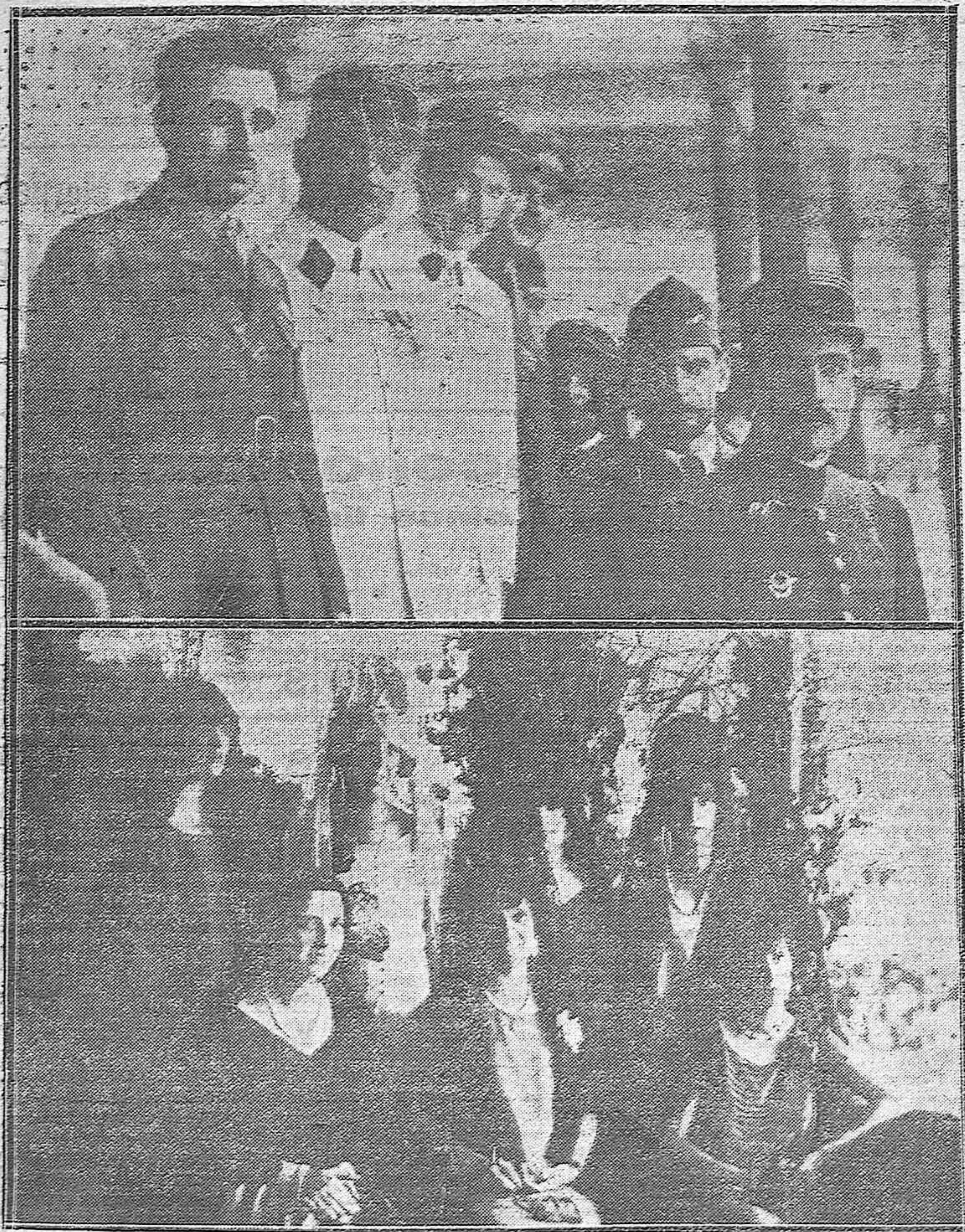
NOTAS GRÁFICAS MALAGUEÑAS.--Los aviadores franceses y norteamericanos de la escuadrilla Lafayette que aterrizó en Málaga de paso para Fez, presenciando la corrida de la Prensa.--Aristocráticas damas y señoritas que presidieron la fiesta.