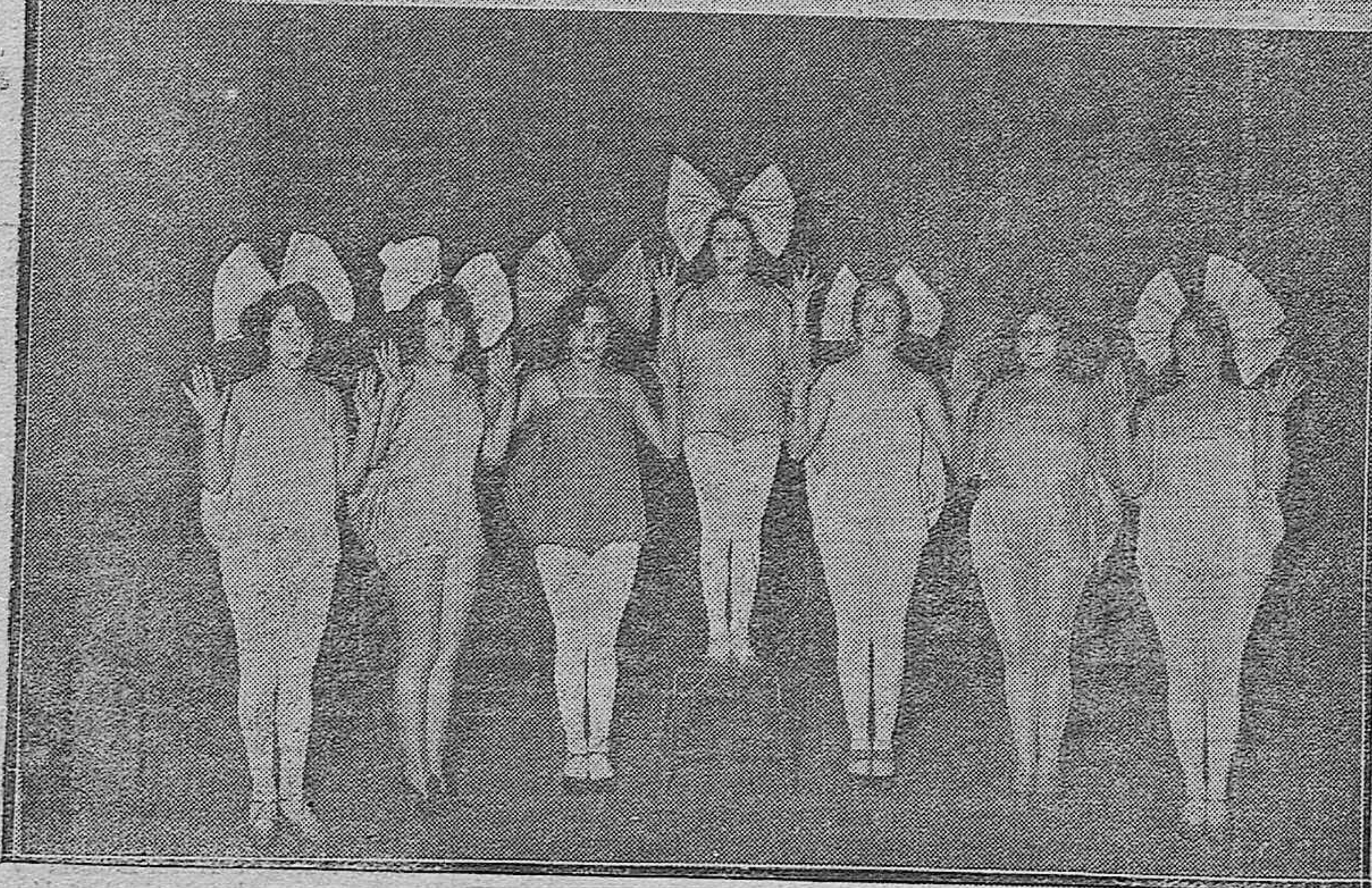
ACTUALIDAD TEATRAL.--La agrupación artística denominada "Frivolidad", notable número de variedades que anoche hizo su presentación en la Plaza de Toros con el beneplácito del público.