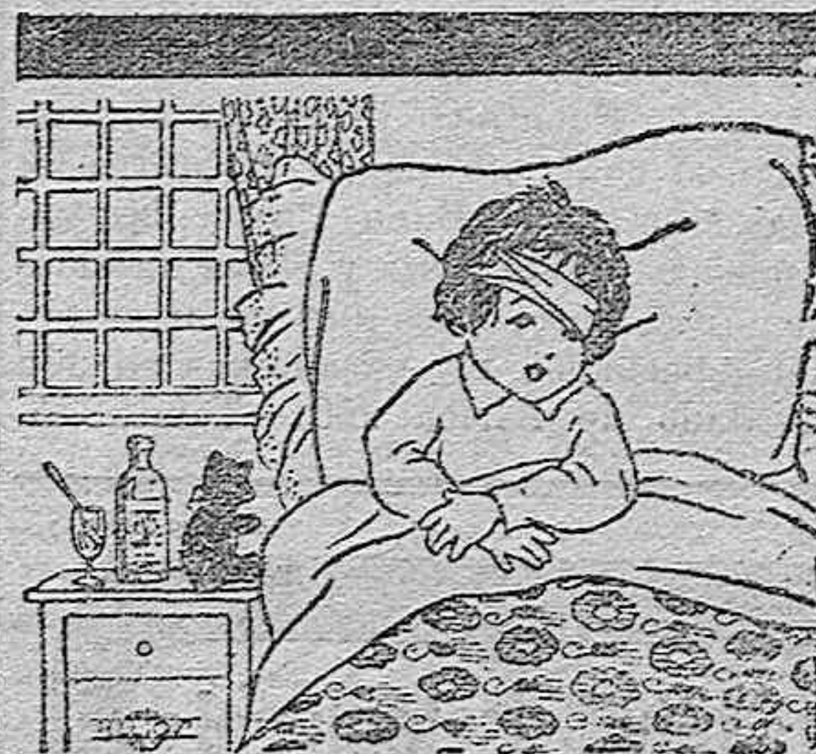
Manolito está en cama. ¿Qué tendrá Manolito?

Si quereis vestir bien y económicamente, dirigirse a EL METRO. Casa Central, Mármol de Bañuelos, 2. Sucursales, San Agustín, 30 y Deanes, 29 y 31