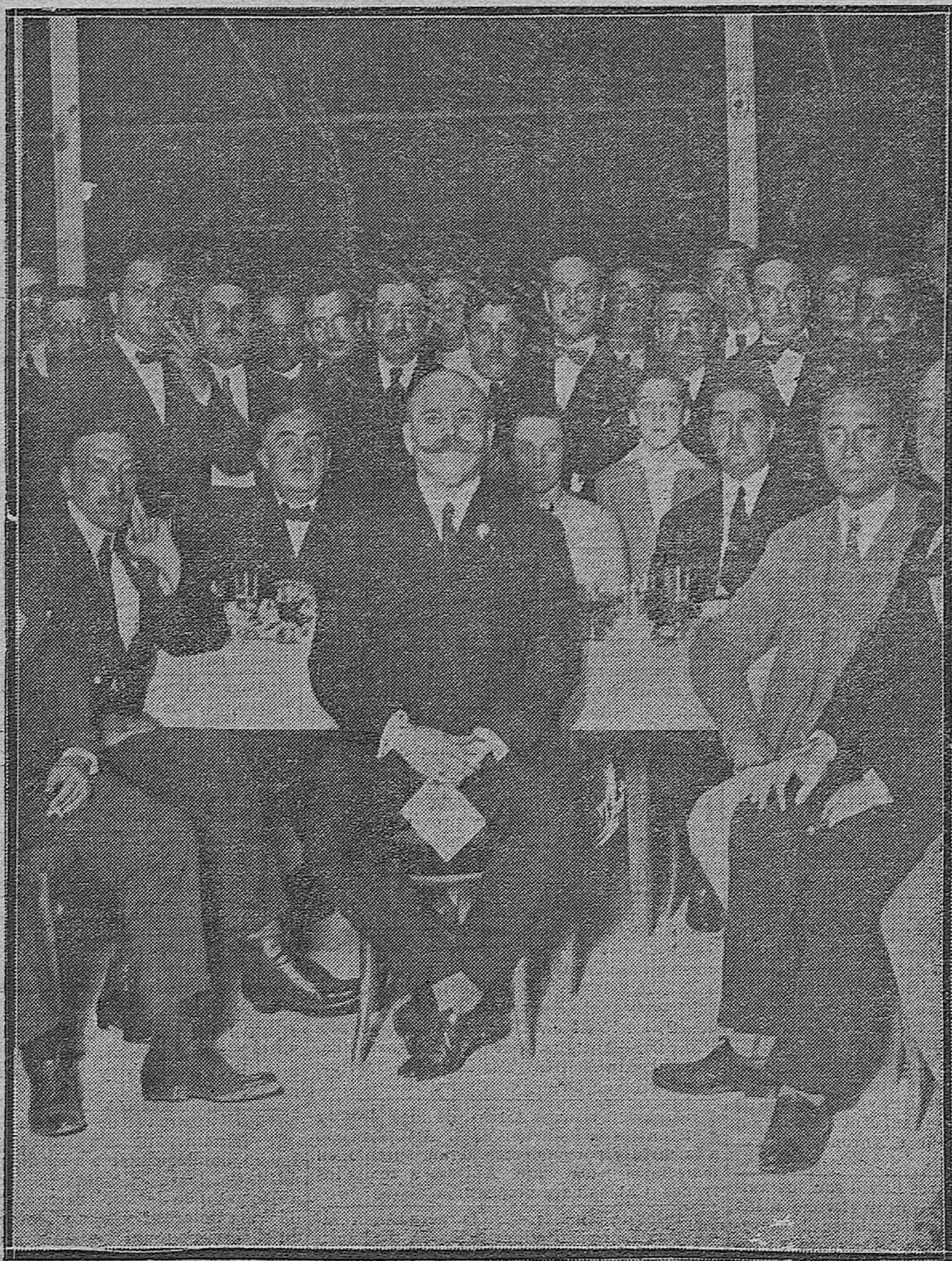
EL COMITÉ DE HIGIENE DE LA SOCIEDAD DE LAS NACIONES.--Autoridades y concurrentes al banquete con que los Colegios de Médicos y Farmacéuticos obsequiaron a los delegados extranjeros.