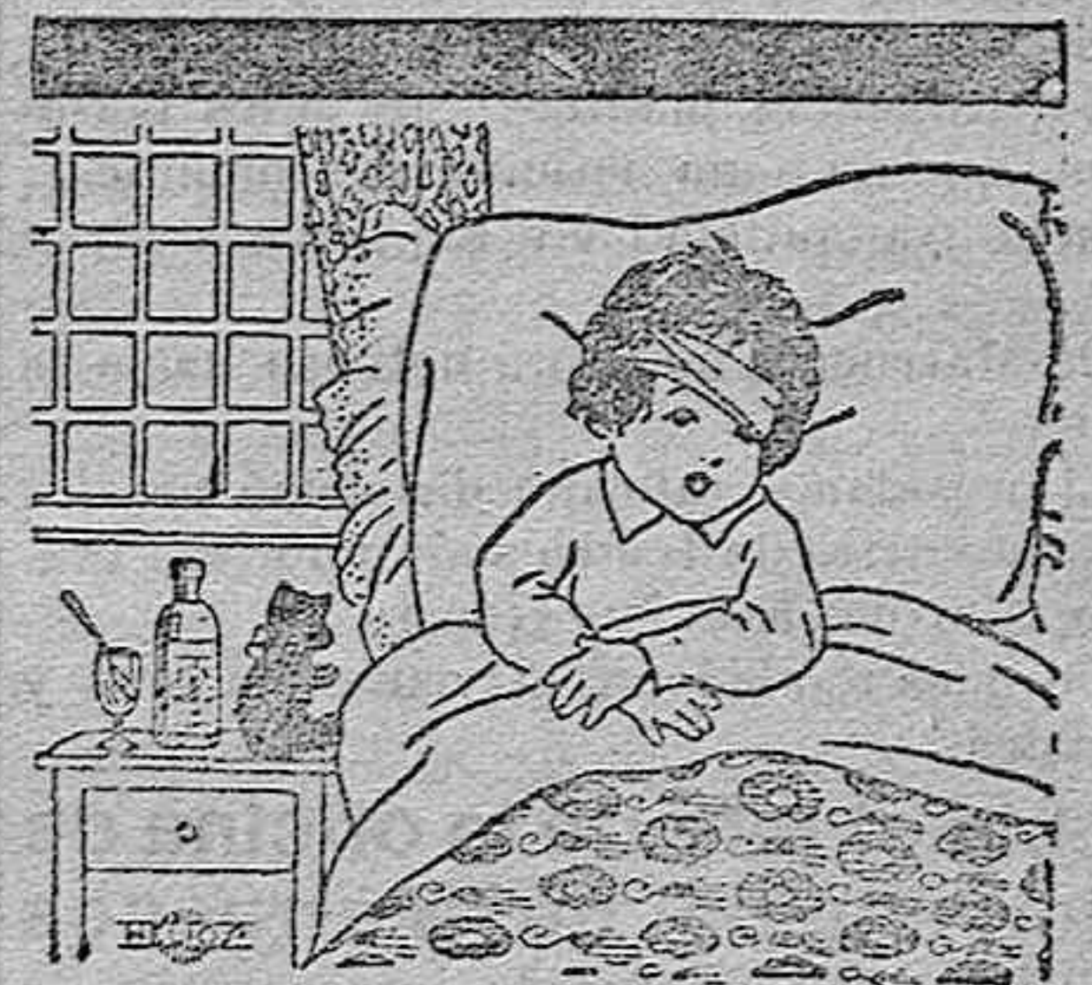
Manolito está en cama. ¿Qué tendrá Manolito?

Terminada ésta sería nombrado un personaje civil para el cargo de residente en la zona del protectorado.