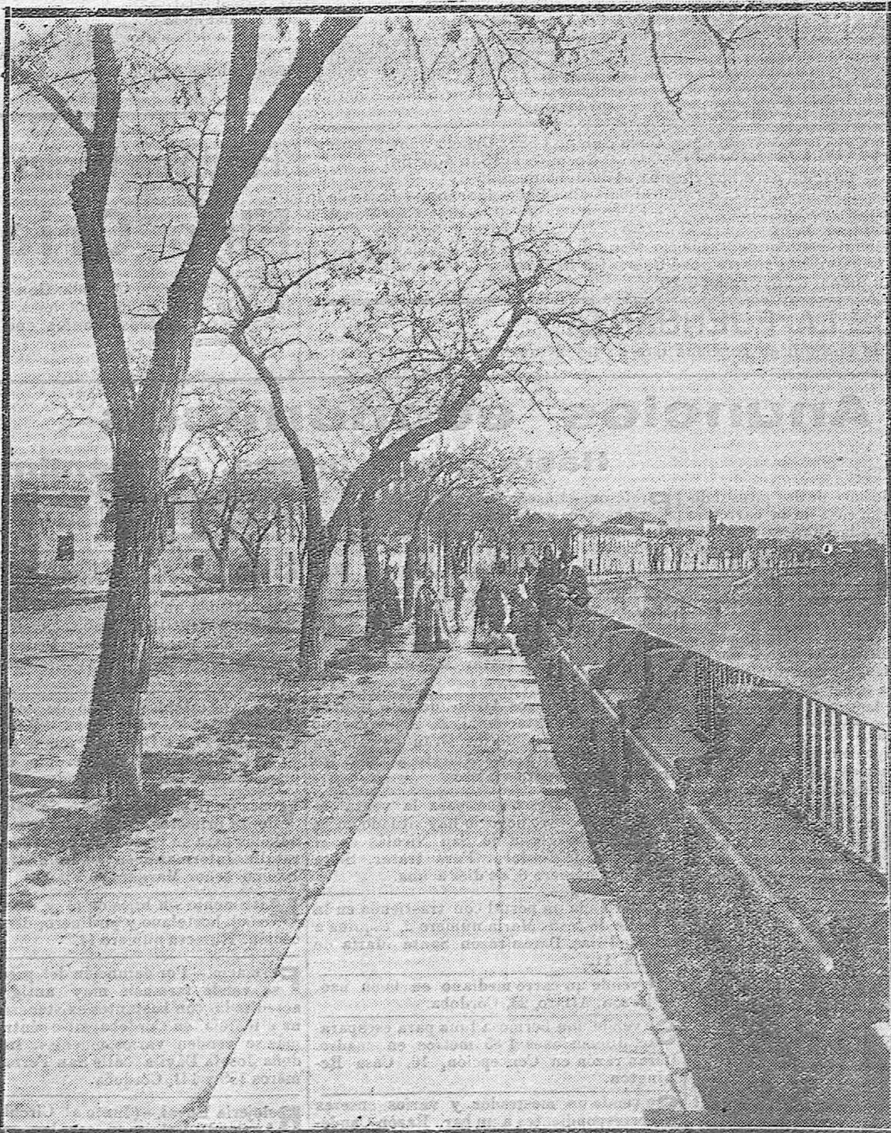
PASEOS DE CÓRDOBA. --El de la Ribera, que hace años era el preferido por los cordobeses en la época de verano.