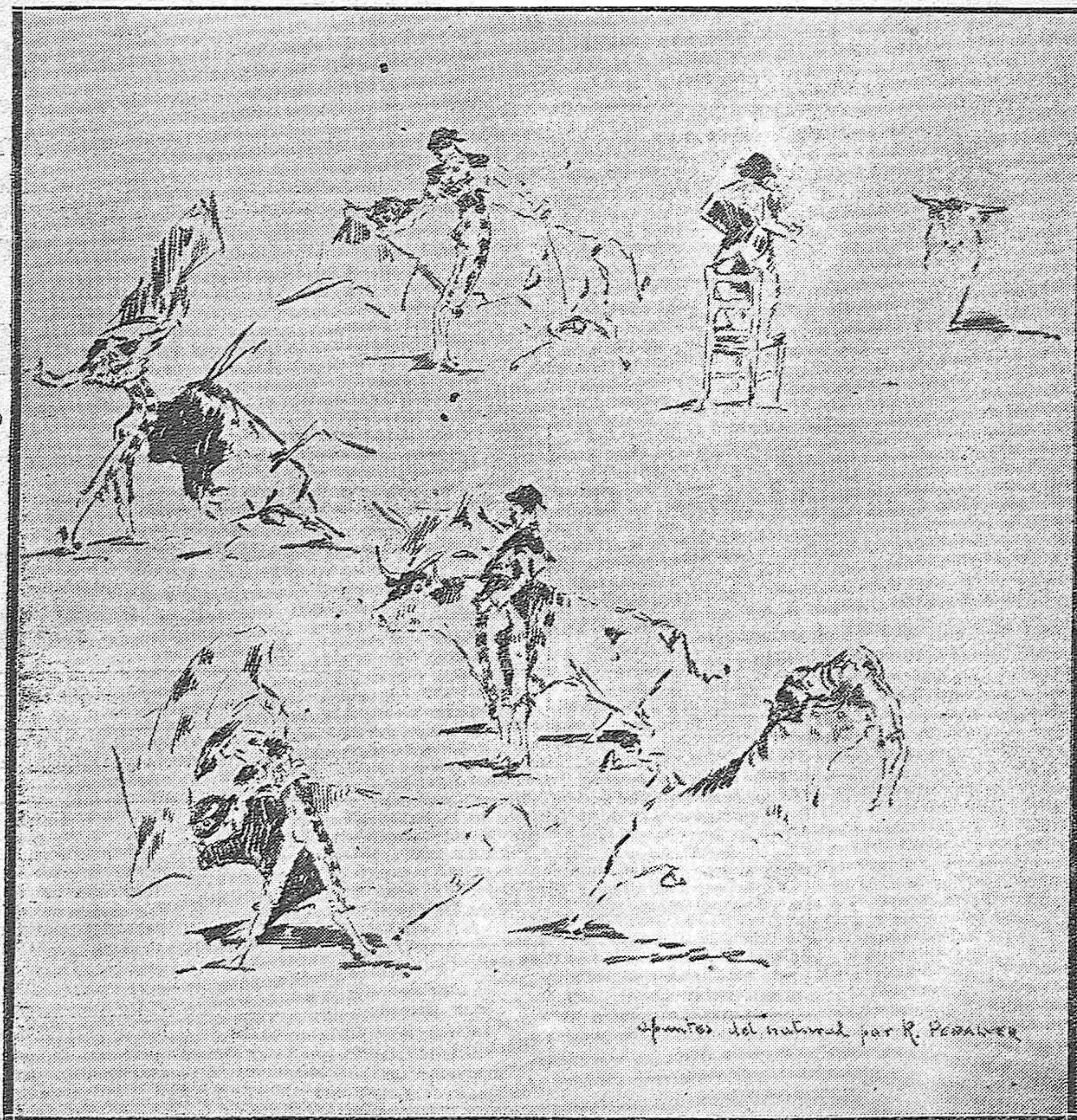
LA NOCTURNA DEL SÁBADO.--Charlot de Málaga preparándose para dar el salto píanche.--(En el centro) Un parado pase de pecho de «Parrita».--Muñoz el «Emocionante» en un natural, otro de pecho, un farol y en su aparatosa cojida por el segundo novillo de la parte seria del espectáculo. (Apuntes tomados del natural por Rafael Peñalver).