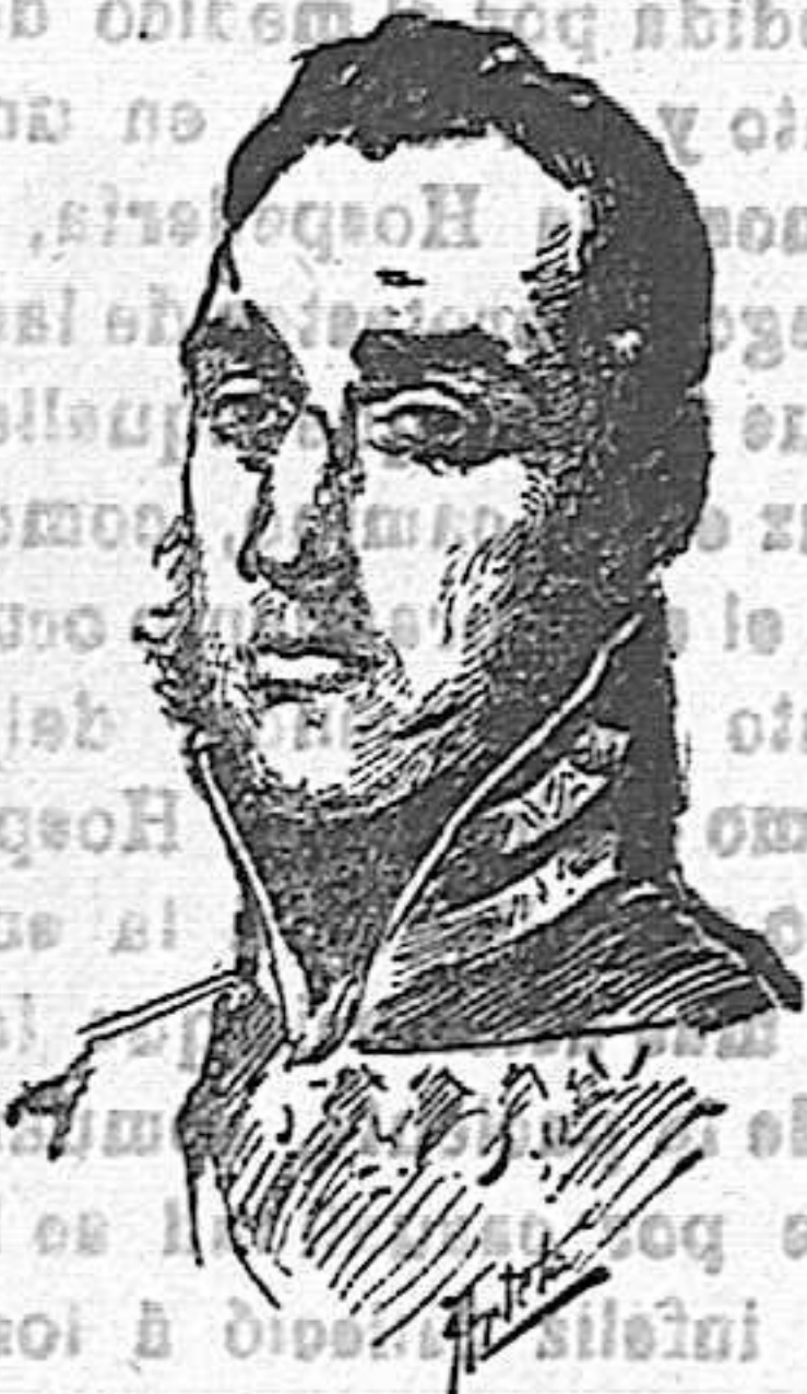
EL GENERAL QUESADA

Aunque en algunos casos los términos medios suelen dar excelentes resultados, no siempre son beneficiosos, porque pueden multiplicar los odios por convertir en enemigos á los propios partidarios. Este le ocurrió al general don Vicente Genaro de Quesada, quien, siendo defensor de las ideas retrógradas, fué asesinado el 15 de Agosto de 1836 por los realistas, por suponerle amigo de los liberales, á consecuencia de oponerse á todo género de excesos y atropellos, ser mgnánimo con sus enemigos políticos y salir siempre al paso de los realistas que ponían por pantalla á la política para dar satisfacción á sus apetitos de venganza ó á sus instintos criminales.