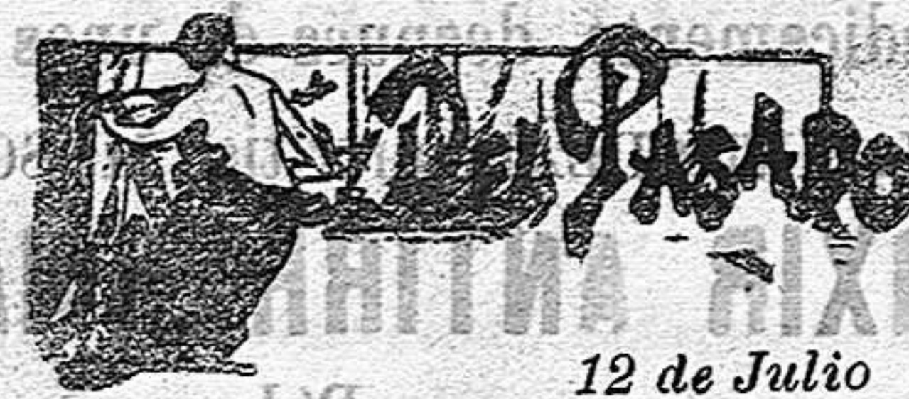
12 de Julio

Ortopedia completa, vinos y jarabes medicinales, específicos nacionales y extranjeros, aguas minerales, etc., etc.