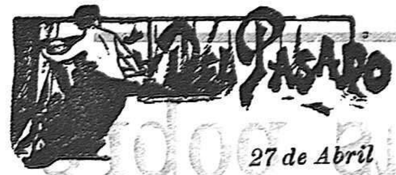
27 de Abril