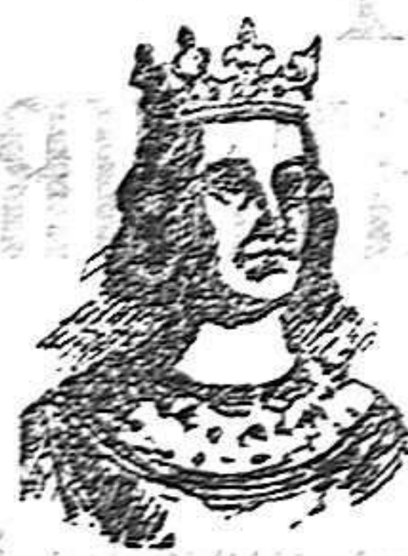
LUIS IX DE FRANCIA

Por su acoendrada religiosidad, y por los sacrificios a que se sometió para arrancar del poder de los infieles el Santo Sepulcro, Luis IX, de Francia, mereció ser canonizado por nuestra Iglesia, gracias a lo cual ocupa puesto distinguido en el Año Cristiano, recompensa sobradamente merecida por tan virtuoso y esclarecido varón.