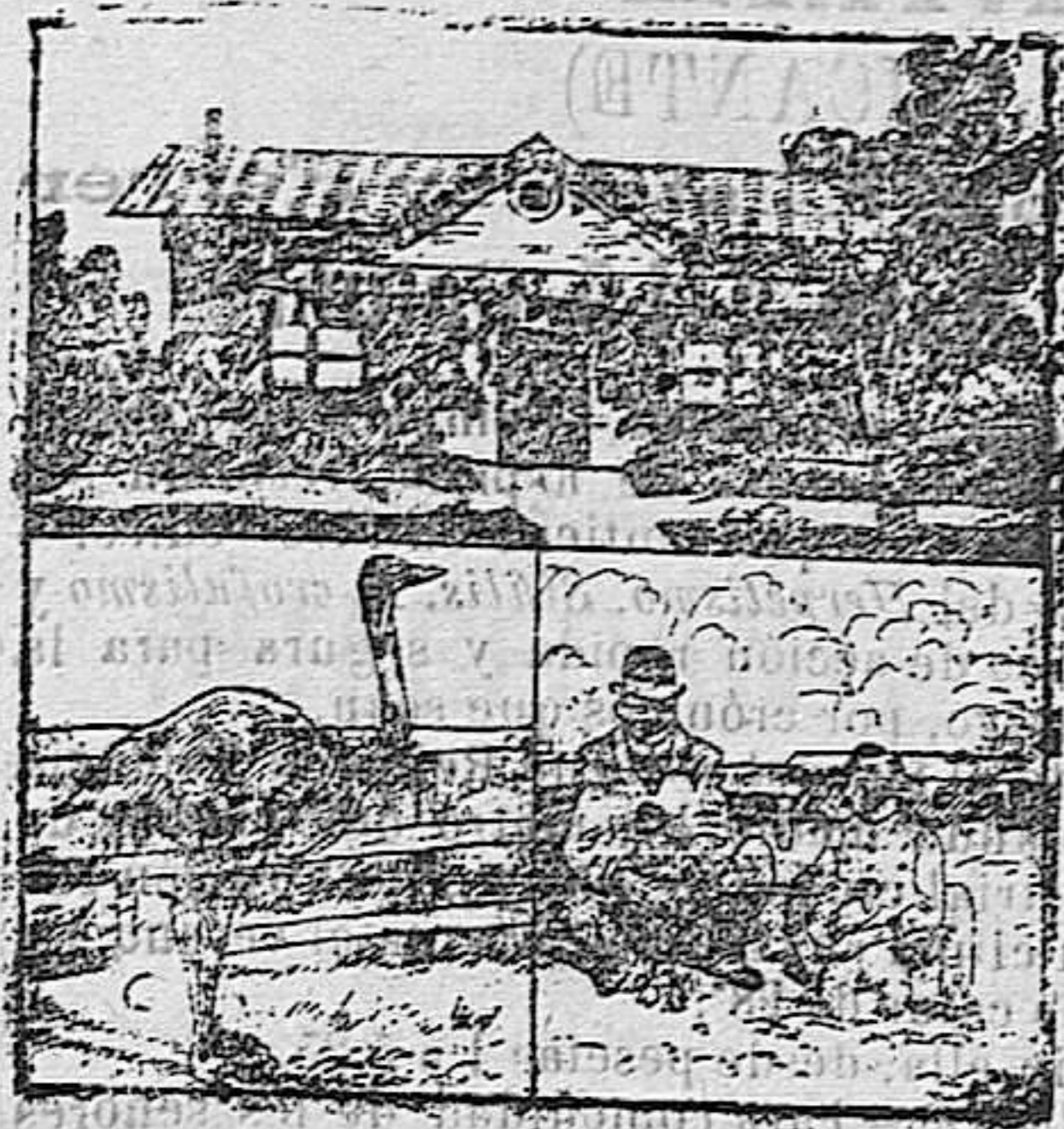
Vista exterior de la granja.—Uno de los más hermosos avestruces.—Crias de avestruces.

Desde que la pluma de avestruz ha llegado a adquirir en los mercados de todos los países precios elevados, los comerciantes no se dan punto de reposo por acrecentar el número de estos animales y dedican sus más exquisitos cuidados a que sus