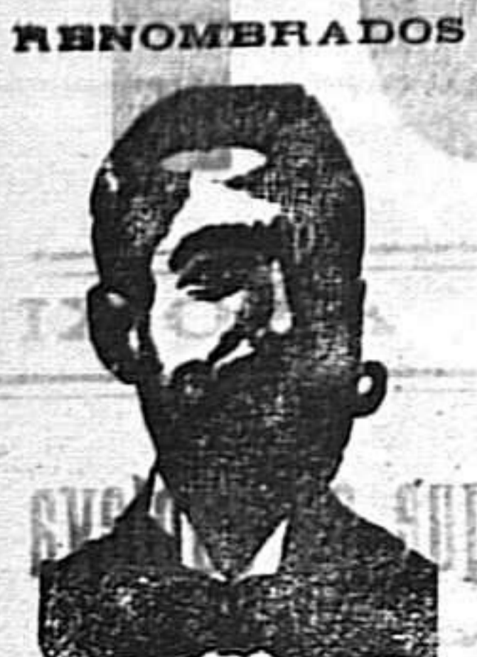
INVENTOR DE LOS MEDICAMENTOS