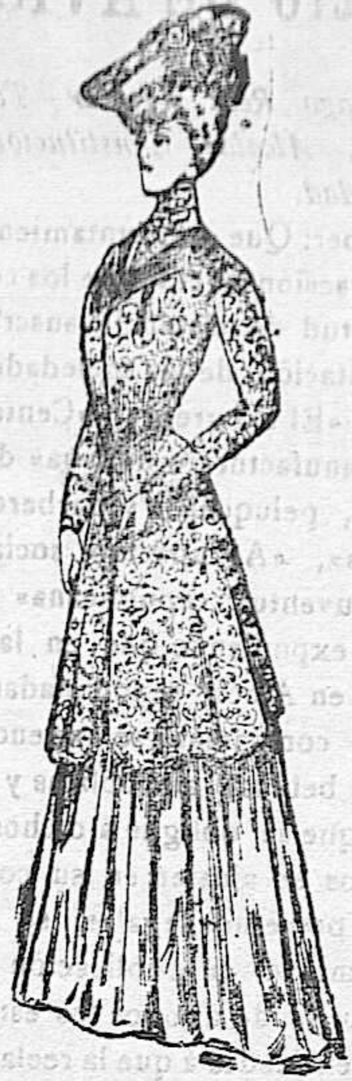
Paletó de entretiempo

Confeccionase con lanilla inglesa y re- vietese con caprichosos adornos de pasa- manería de seda. Cuello y pechero de seda clara; corbata de blondas, formando tres órdenes, como las mangas. Puños igual que el cuello.