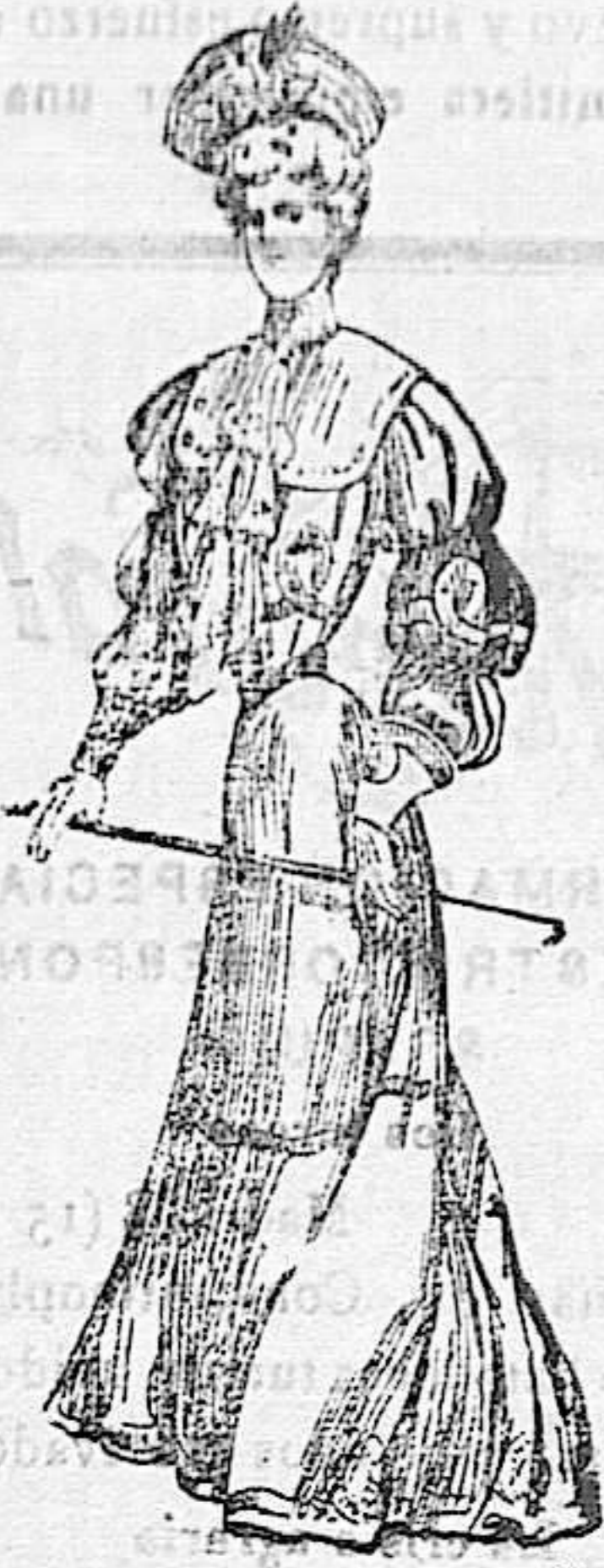
Traje para paseo y visita, de tela fantasía, rameada.

El delantero, liso, no ofrece nada de particular, y si la espalda del cuerpo to- rera, recamada de blondas, así como la falda, cuyos volantes son bastante vis- tosos.