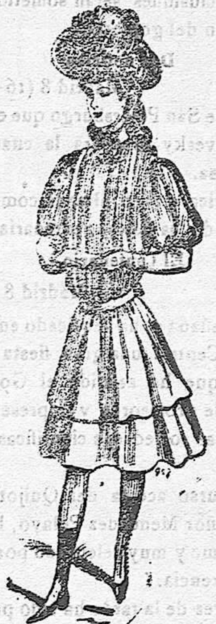
Trajecito para niña de 7 á 12 años. De color algo obscuro; cuerpo y falda á pliegues. Cinturón de seda blanco; cuello alto y corbata de seda.

El delantero, liso, no ofrece nada de particular, y si la espalda del cuerpo to- rera, recamada de blondas, así como la falda, cuyos volantes son bastante vis- tosos.