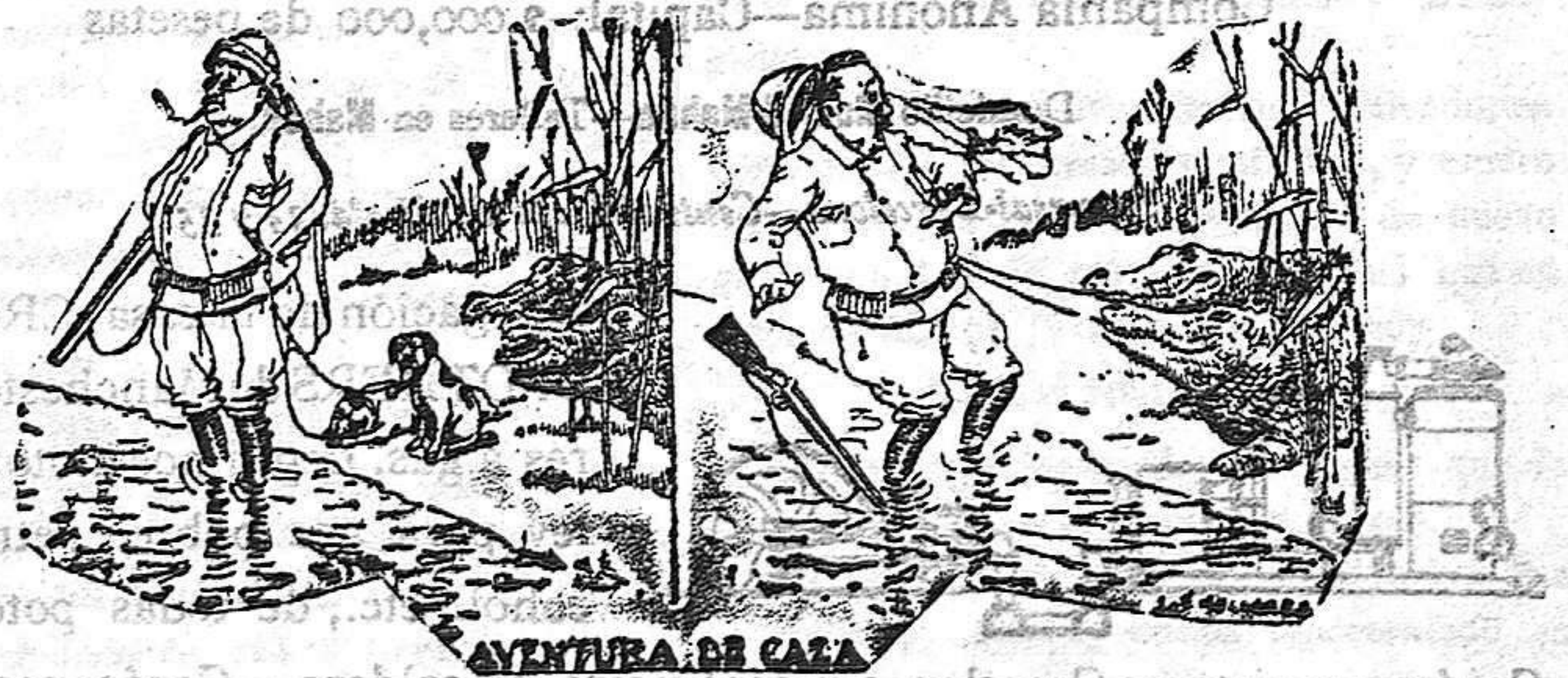
AVENTURA DE CASA

Imprenta LA DEFENSA Venerable Ridaura, 8.— Alcoy.