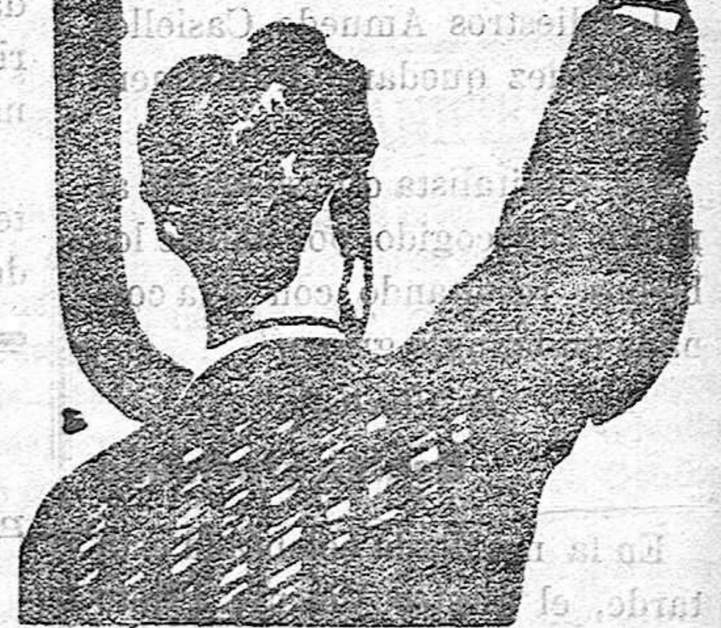
PREPARADO EN VALLECAJAL Y MADRID

y los Médicos le llaman el REMEDIO DE LOS DÉBILES