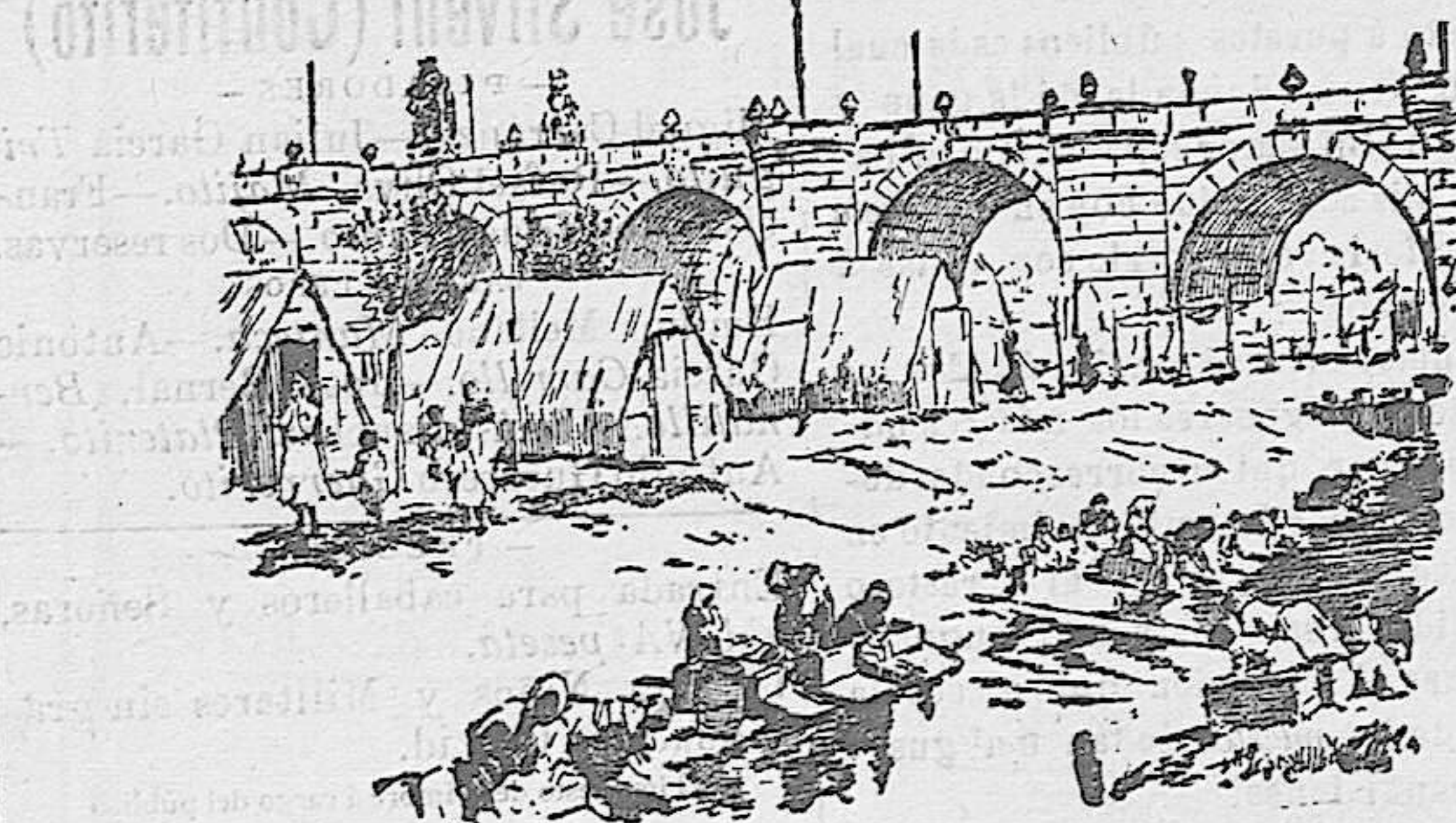
Lavaderos y cabañas del puente de Toledo

El conflicto es de mucha gravedad, porque nadie sabe distinguir los sevillanos de los legítimos, dándose el caso en Cartagena de que sean devueltos por el comercio duros legítimos.