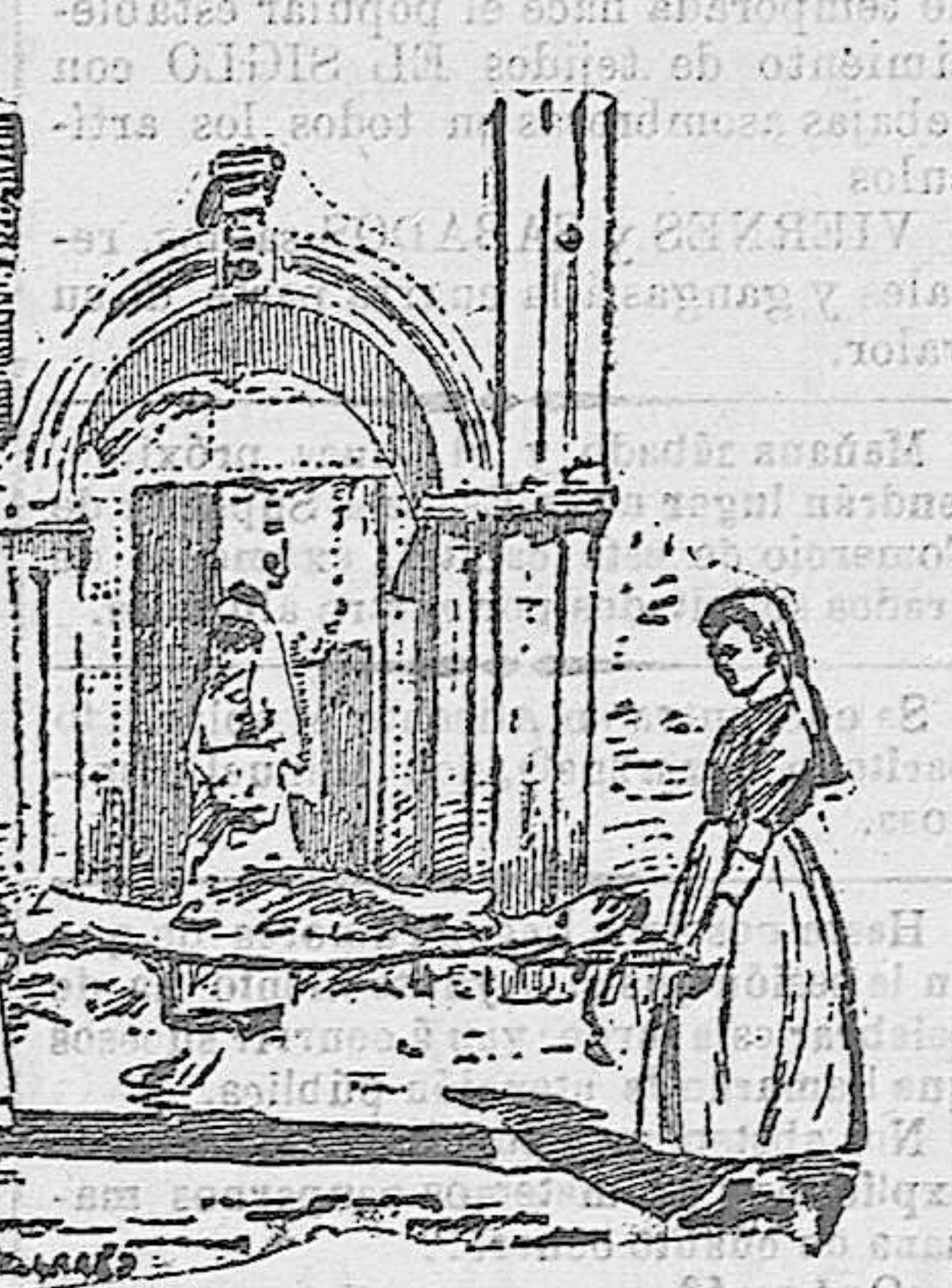
El transporte de heridos en Casablanca

Los cuidados, el afecto y el interés que esas doce mujeres, jóvenes todas, han manifestado por los heridos, así franceses como españoles, como indi-