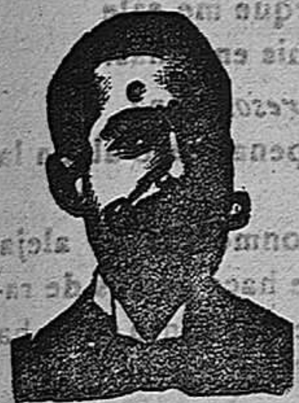
A. SALVATI COSTANZI CALLE DIPUTACION, 435 BARCELONA

M. Torregrosa (antes Vall) número 2.—ALCOY