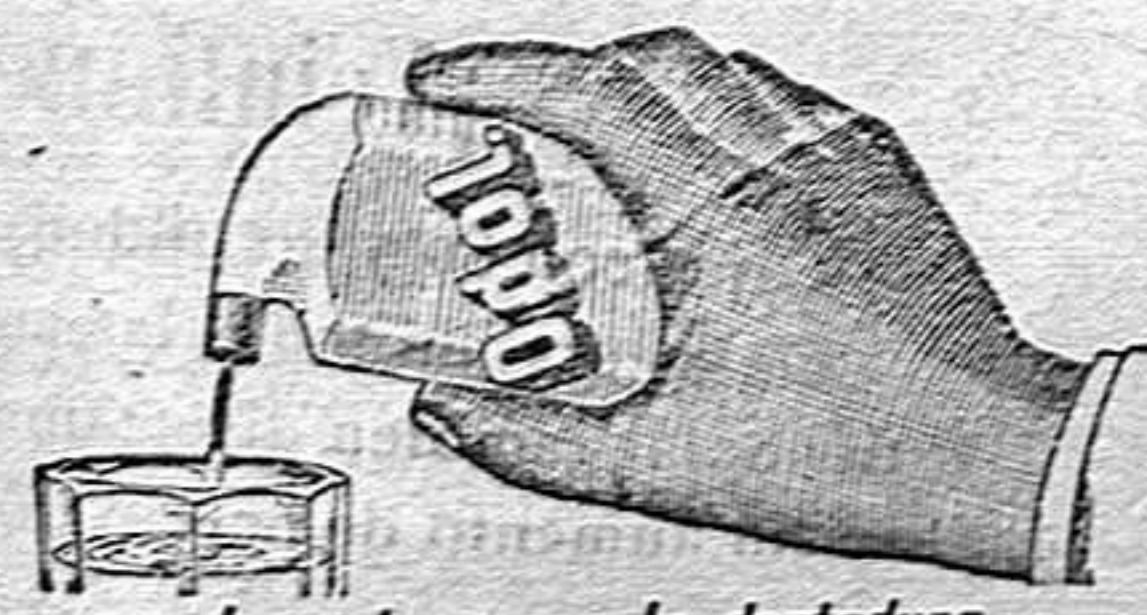
lo mejor para la dentadura el frasco Ptas 3.50

Único punto de venta en Alcoy: Farmacia Moderna, de A. Segura.