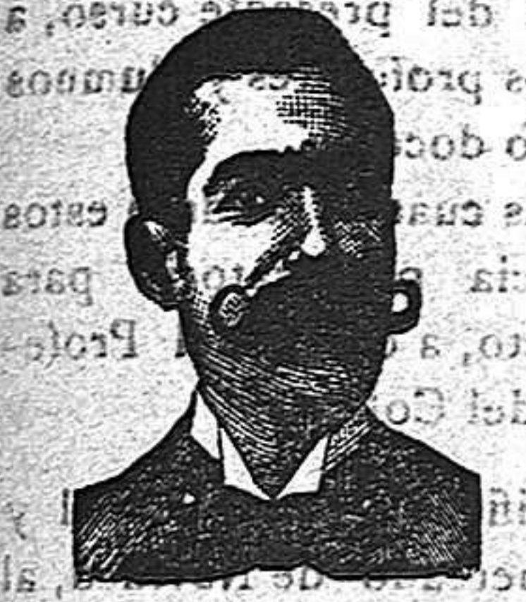
A. SALVATI COSTANZI CALLE DIPUTACIÓN, 435. BARCELONA

Miles y miles de celebridades médicas, después de una larga experiencia, se han convenido y certificado, que para curar radicalmente los extreñimientos urétrales (estrechez), flujo blanco de las mujeres, arenillas, catarro de la vejiga, cálculos, retenciones de orina, escozores uretrales, purgación reciente ó crónica, gota militar, y demás infecciones genitourinarias, evitando las peligrosísimas sondas, no hay medicamentos más milagrosos que los Confitas ó Inyecciones Costanzi. También certifican que para curar cualquier enfermedad sifilítica ó herpética, en vista de que el Iodo y el Mercurio son dañinos para la salud, nada mejor que el Roob Costanzi, pues no solo cura radicalmente la sífilis y herpes, sino que estriba los malos efectos que producen estas substancias, que como es sabido causan enfermedades no muy fáciles de curar. A. Salvati Costanzi, calle Diputación 435. Barcelona, seguro del buen éxito de estos específicos mediante el trato especial con él, admite á los inérridos el pago una vez curados. Precio de la inyección, pesetas 4. Confitas antivenéreas, para quienes no quieren usar inyecciones, pesetas 5. Roob antisifilítico y antiherpético, pesetas 4. Dichos medicamentos están de venta en casa de A. Salvati Costanzi, Diputación 435, Barcelona, y en todas las buenas farmacias. En Alcoy en la farmacia de la Sra. Viuda de R. Alfonso, calle Polavieja. Consultas médicas en Barcelona calle Diputación 435, entrésuelo 2.º, todos los lunes, miércoles y viernes, á las 12.