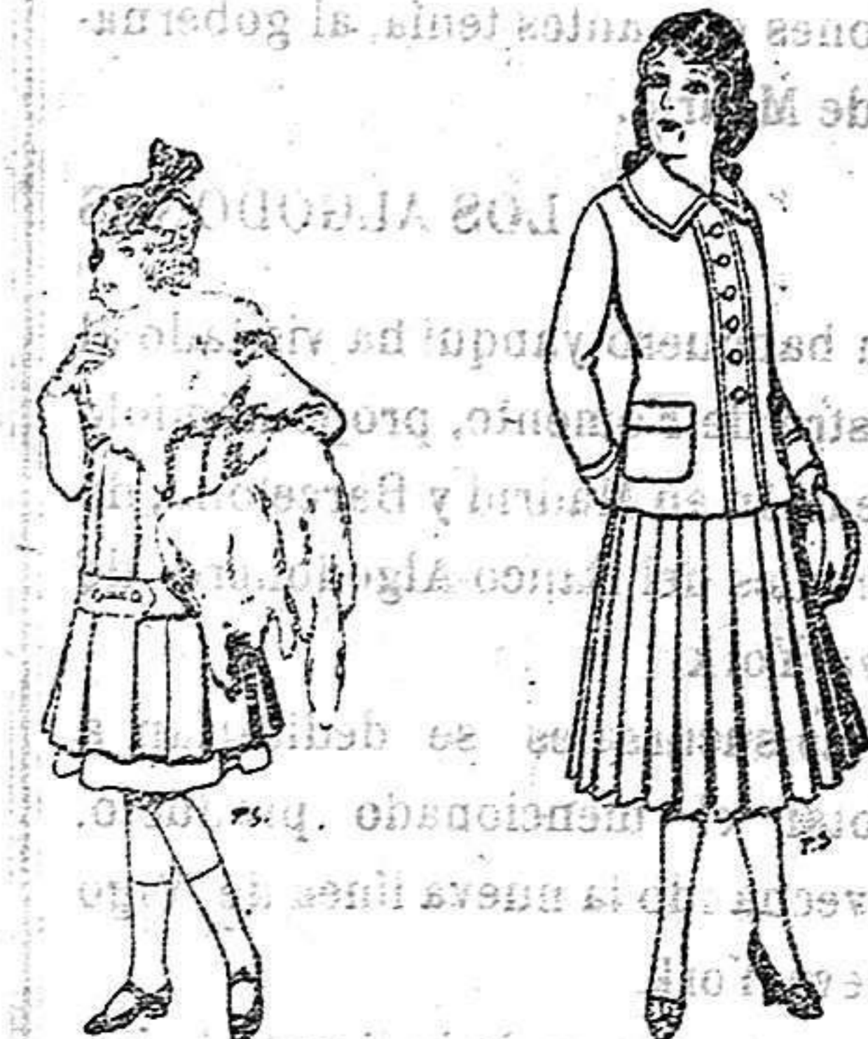
Juego de pieles para niñas. A 15 ptas. Paletor de lana para jovencitas de 13 a 16 años. De 12.50 a 20 ptas.