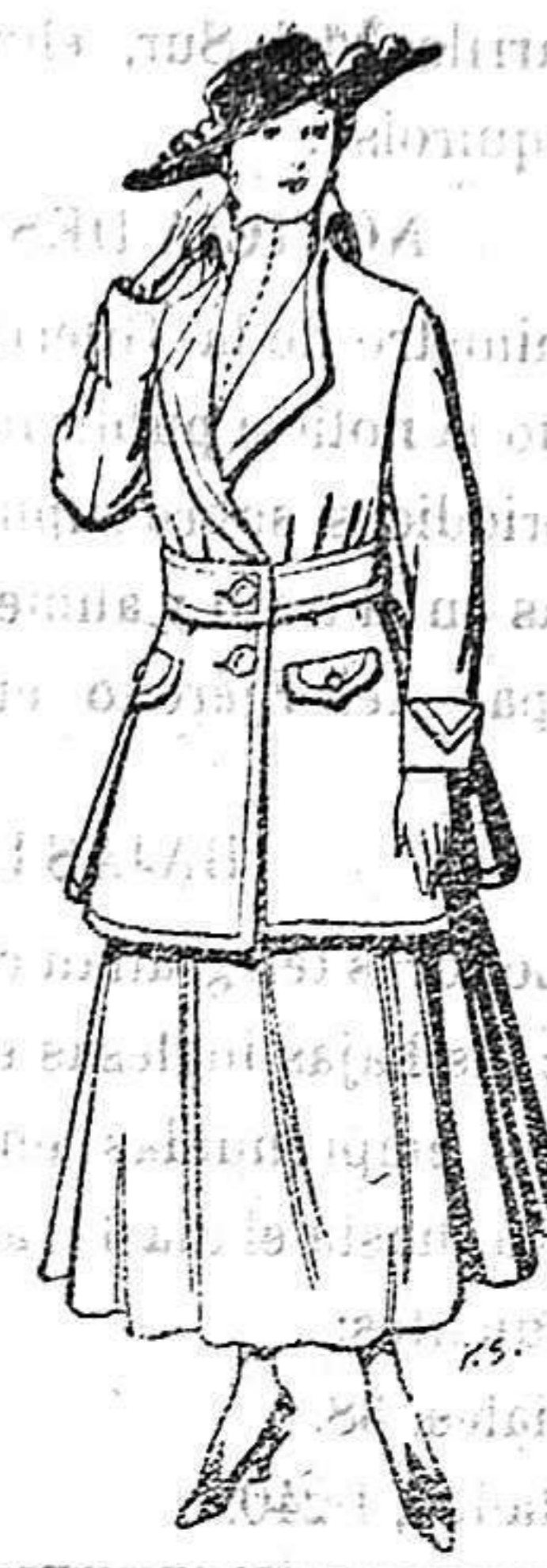
Abrigos de patén gran novedad para señora. De 26 a 40 ptas.