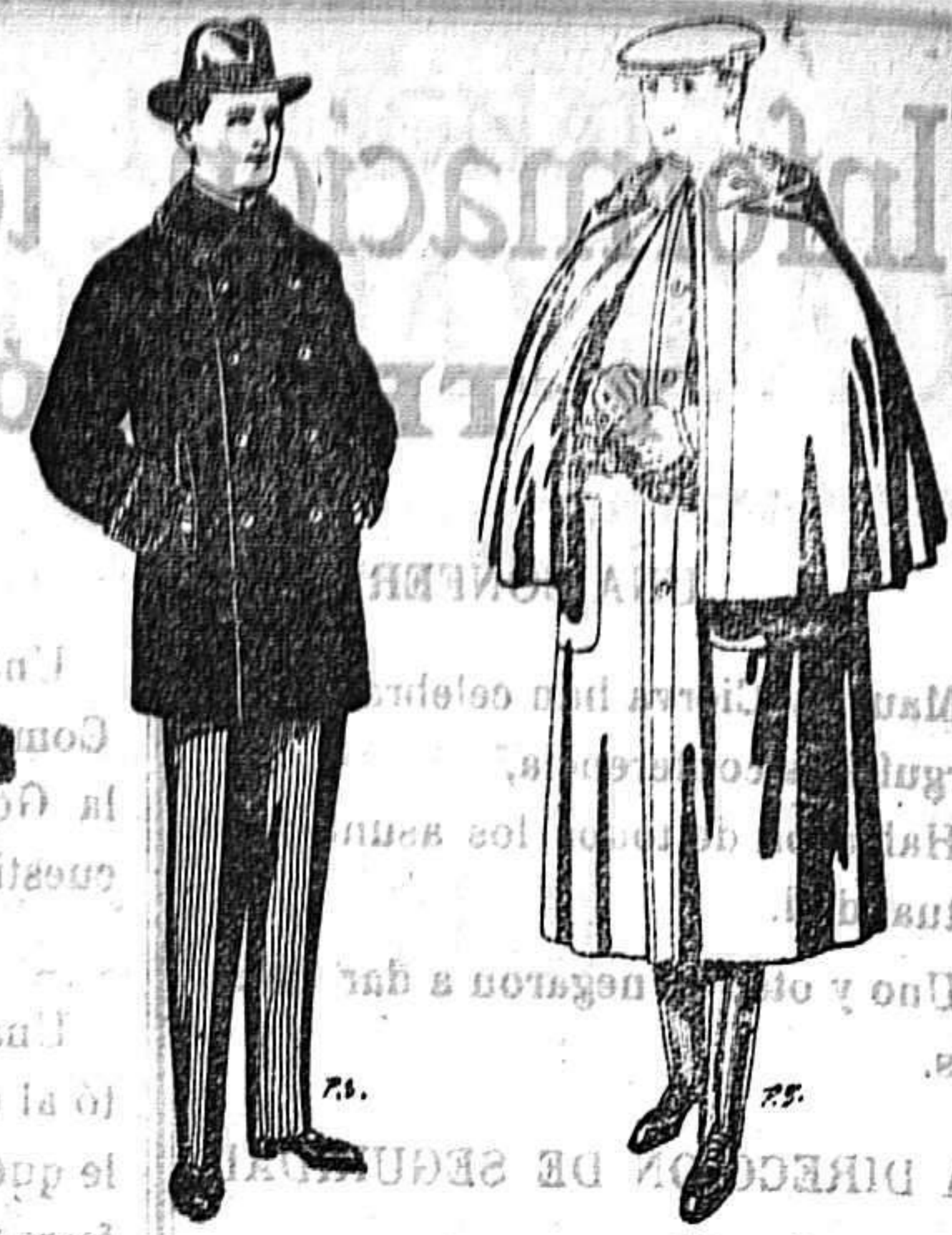
Pelizas con cuello y bocamangas astracán. De 14 a 90 ptas. Impermeables, forma Mackferland en negro y azul. De 55 a 110 ptas.