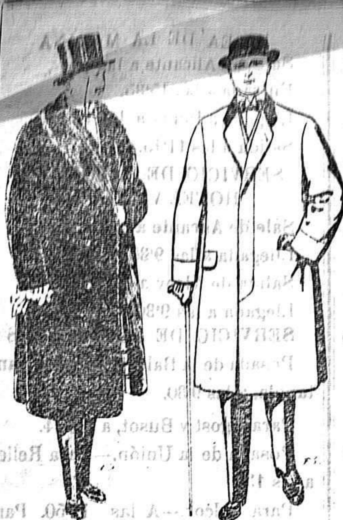
Gabanes de edredón negro forro seda cuello y vistas de piel. A 125 y 135 ptas. Gabanes de paten melton o cheviot. De 25 a 100 ptas.

Peletería, Camisería, Géneros de Punto, Corbatería, Guantería, Sombrerería, Zapatería, Paraguas, Bastones y Artículos de Viaje.