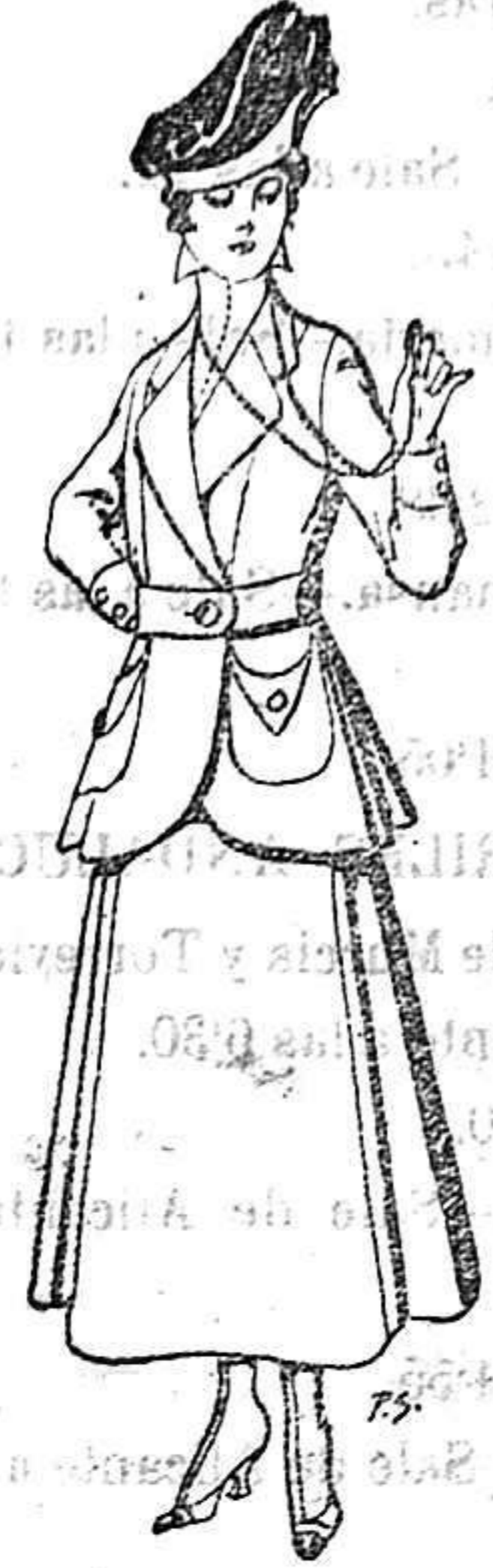
Trajes de lana negra, azul y color para señora. De 50 a 55 ptas.