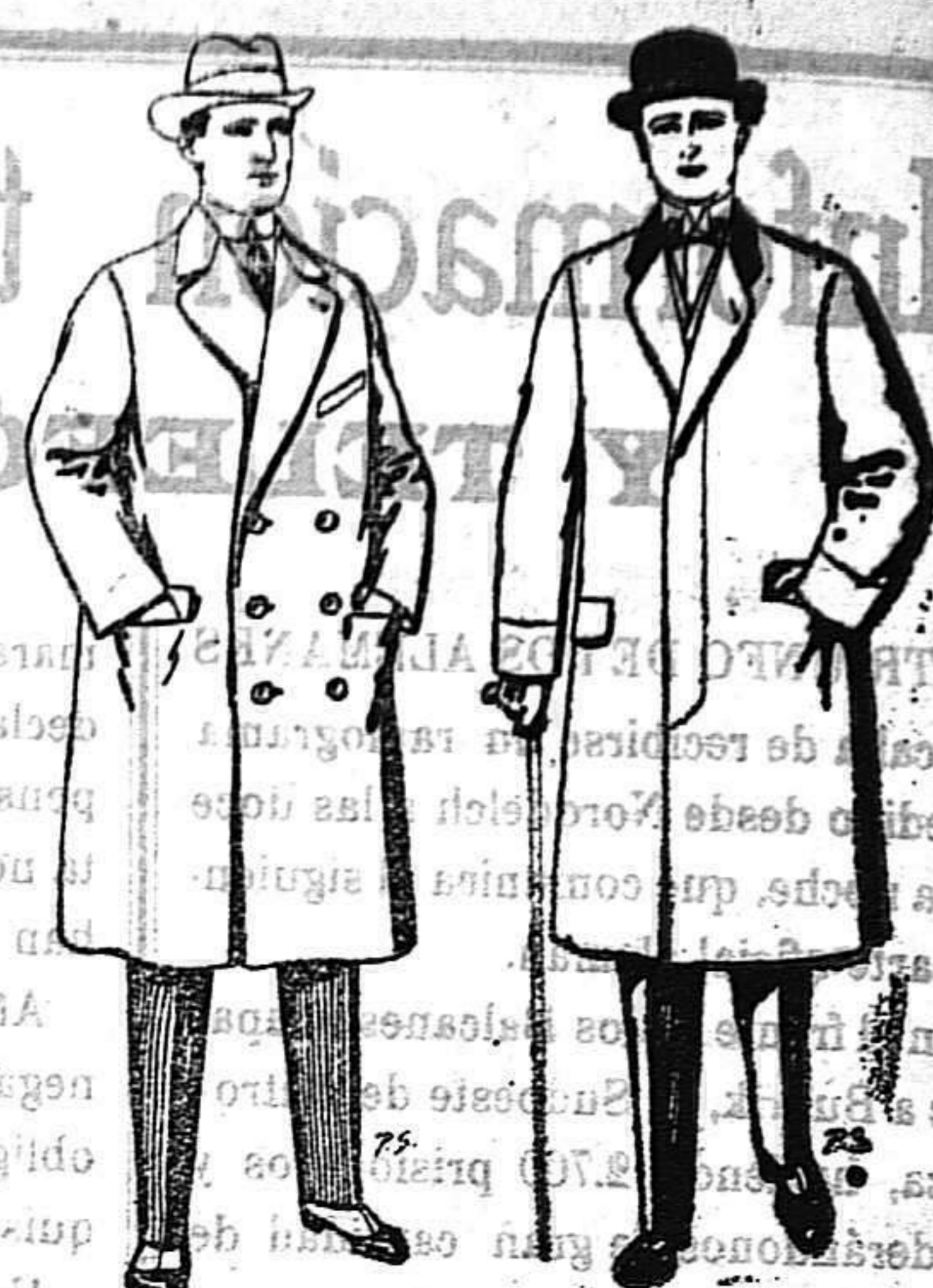
Gabanes de paten cheviot etc. De 55 a 105 ptas.