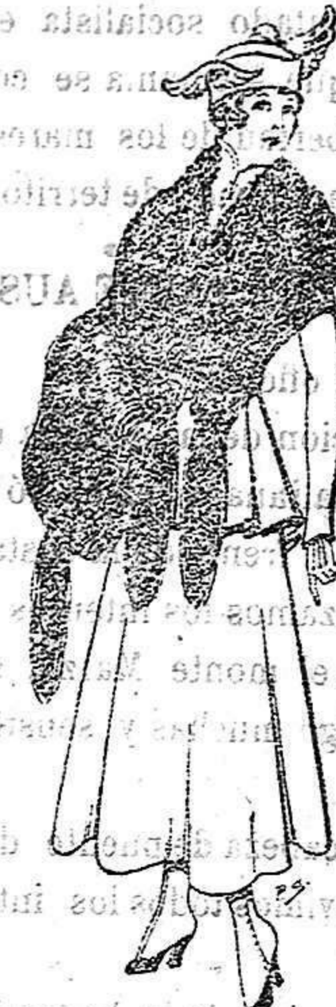
Juego de pieles imitación perfecta al renard negro De 40 a 45 ptas.