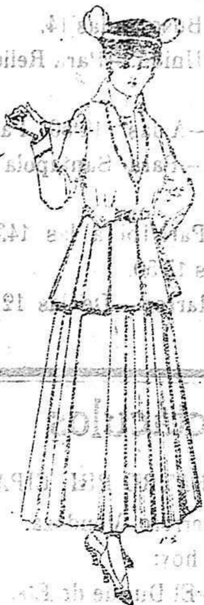
Trajes de lana negra, azul y color para señora A 85 ptas.