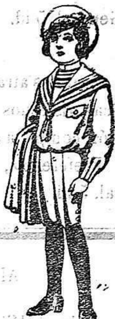
Trajes de jerga negra o azul para niñas de 4 a 9 años De 5 a 10 ptas.