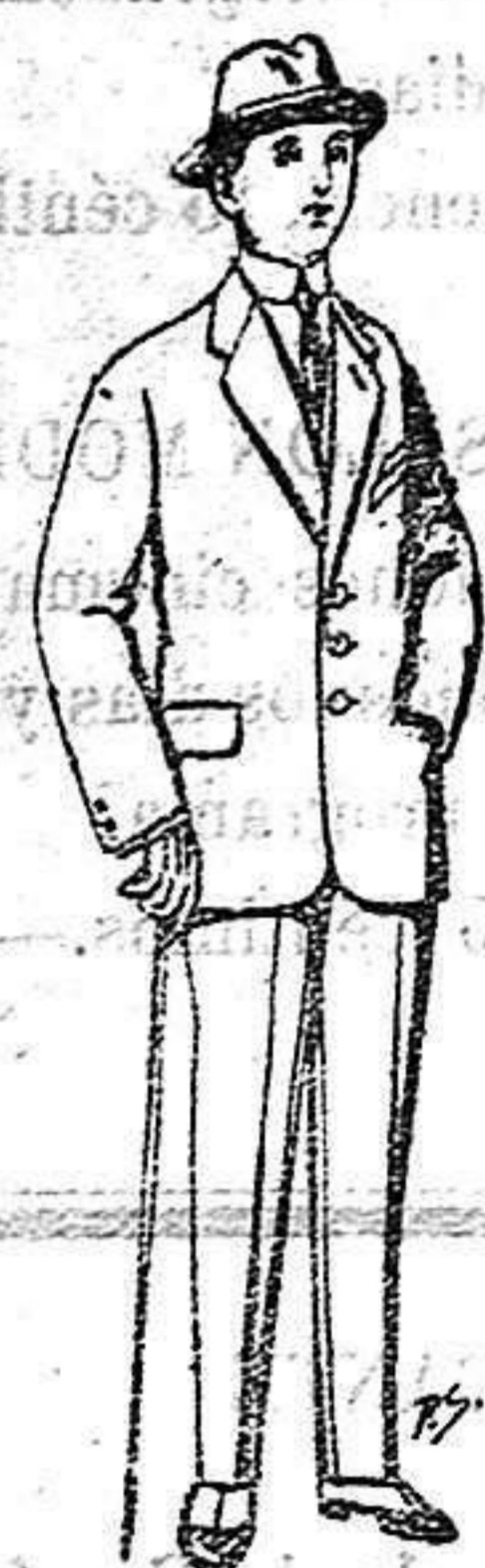
Trajes paten, vi-cuña o jerga para niños de 10 a 16 años De 14 a 50 ptas.