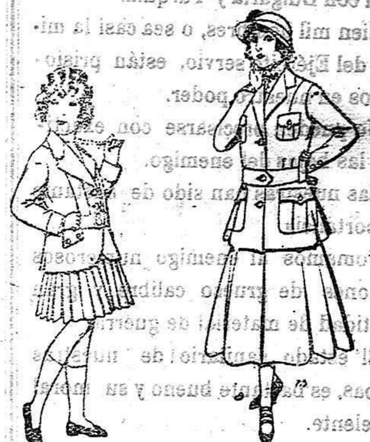
Trajes de lanilla para niñas de 4 a 11 años De 20 a 35 ptas.