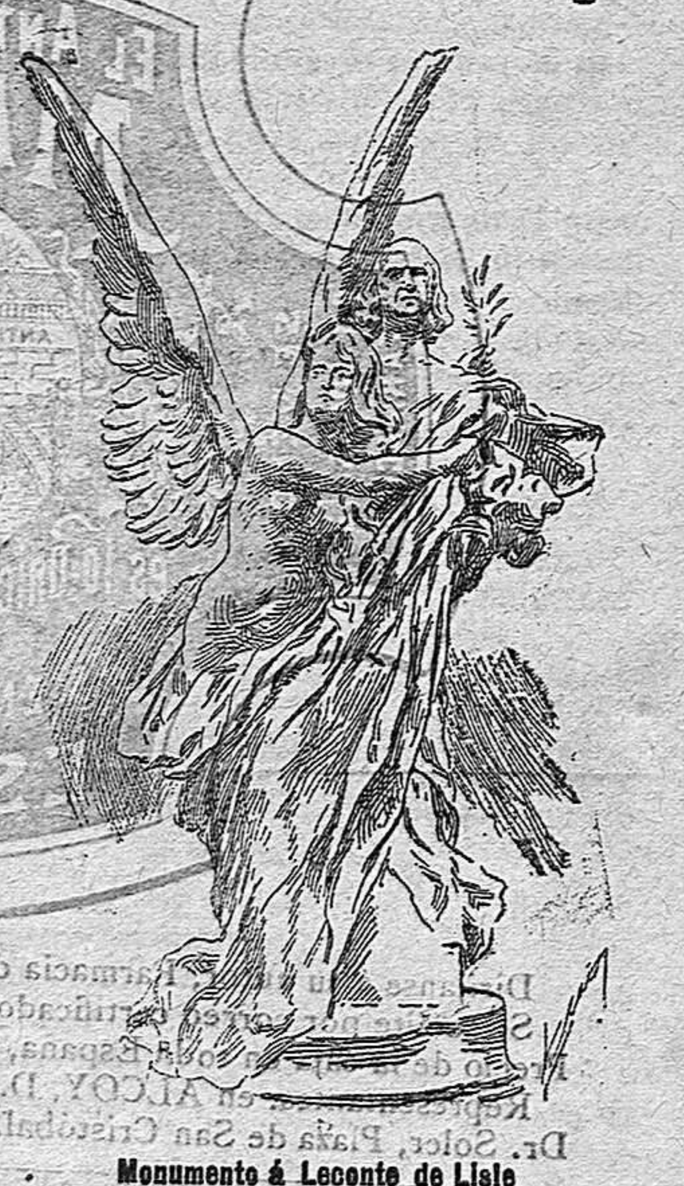
Monumento á Leonce de Lisle