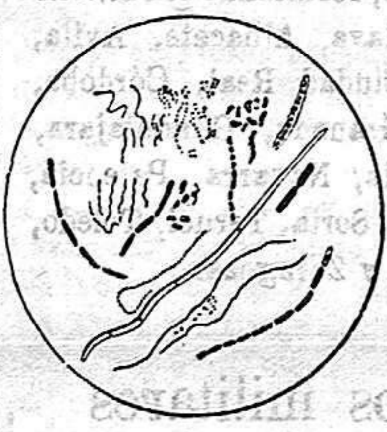
Varias formas de bacterias de la boca

De ahí se deduce lógicamente para toda persona dotada hasta de mediana inteligencia, que si se quiere preservar los dientes del peligro de cariarse, es preciso reducir á la impotencia esas bacterias. Hace un siglo, cuando aparecieron la mayor parte de los dentífricos todavía usados hoy día se ignoraban totalmente la existencia y los trabajos de estos microbios, que hoy, por confesión unánime de los sabios del mundo entero, son reconocidos como causantes de la descomposición y de la caries de los dientes. No se pudo dar, pues, 100 años atrás, con otra cosa que con pobres dentífricos que perfumaban algo la boca, pero que no podían menos de dejar corromperse los dientes. La ciencia moderna, al contrario, no sólo ha hallado la verdadera causa de la caries, sino que