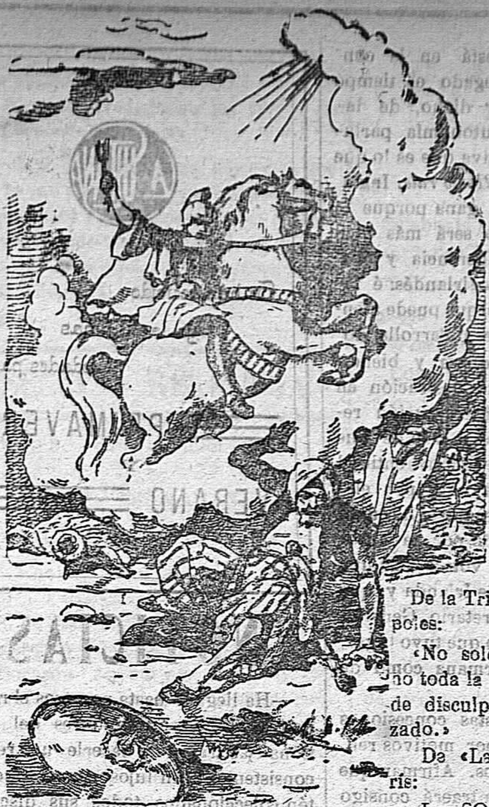
Juicio Mártir San Jorge Defiende al pueblo de Dios

Precios de suscripción Alcoy al mes . . . . . 1'50 Ptas. Para los obreros al mes. 0'75 Ptas. Fuera al trimestre . . . . . 4'50 Ptas. Número atrasado . . . . . 0'15 Ptas.