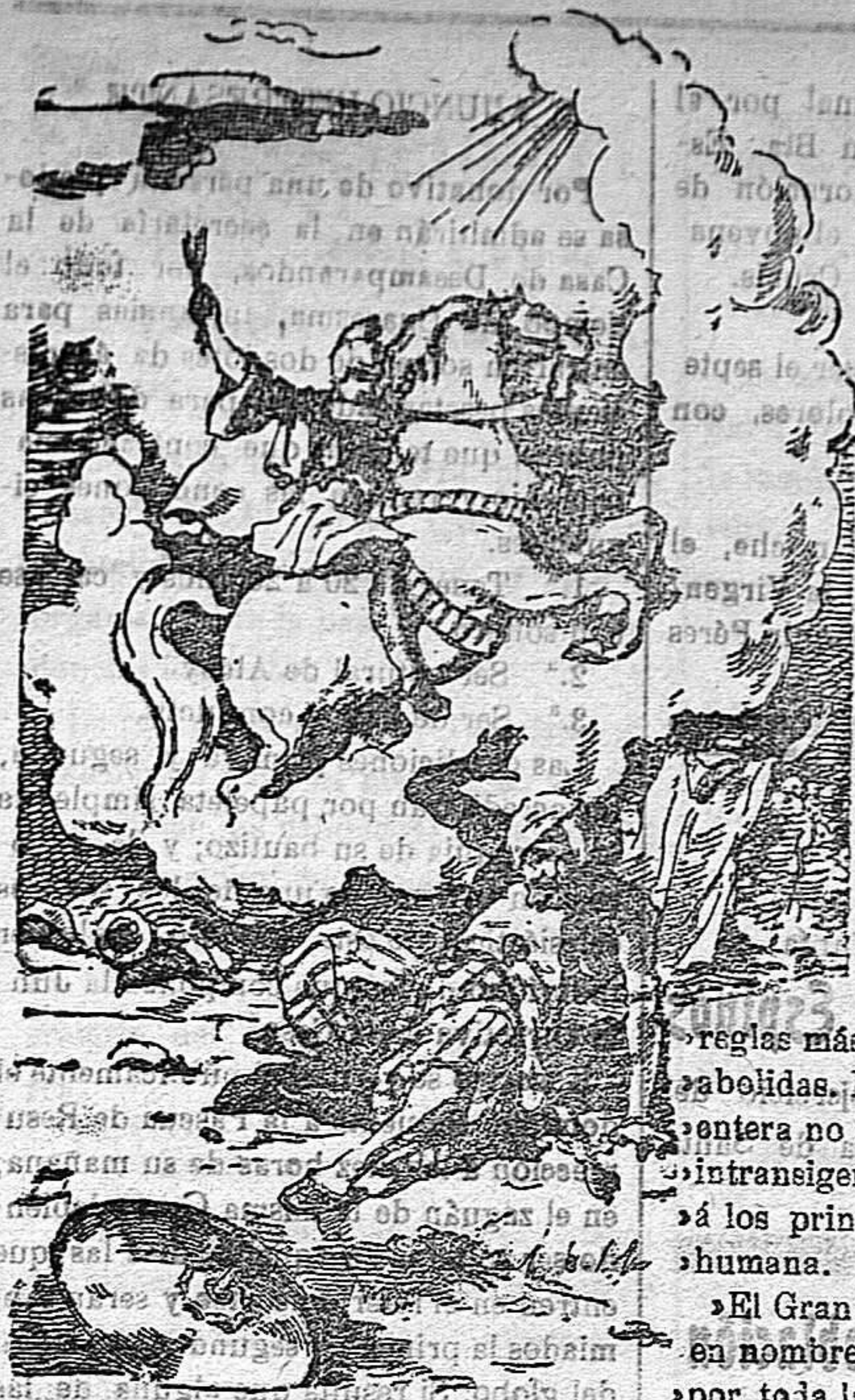
¡Victor-Mártir San Jorge! Venid ad adorandum populo Dei. Defiende al pueblo de Dios

Precios de suscripción Alcoy al mes . . . . . 1'50 Ptas. Para los obreros al mes. 0'75 Ptas. Fuera al trimestre . . . . . 4'50 Ptas. Número atrasado . . . . . 0'16 Ptas.