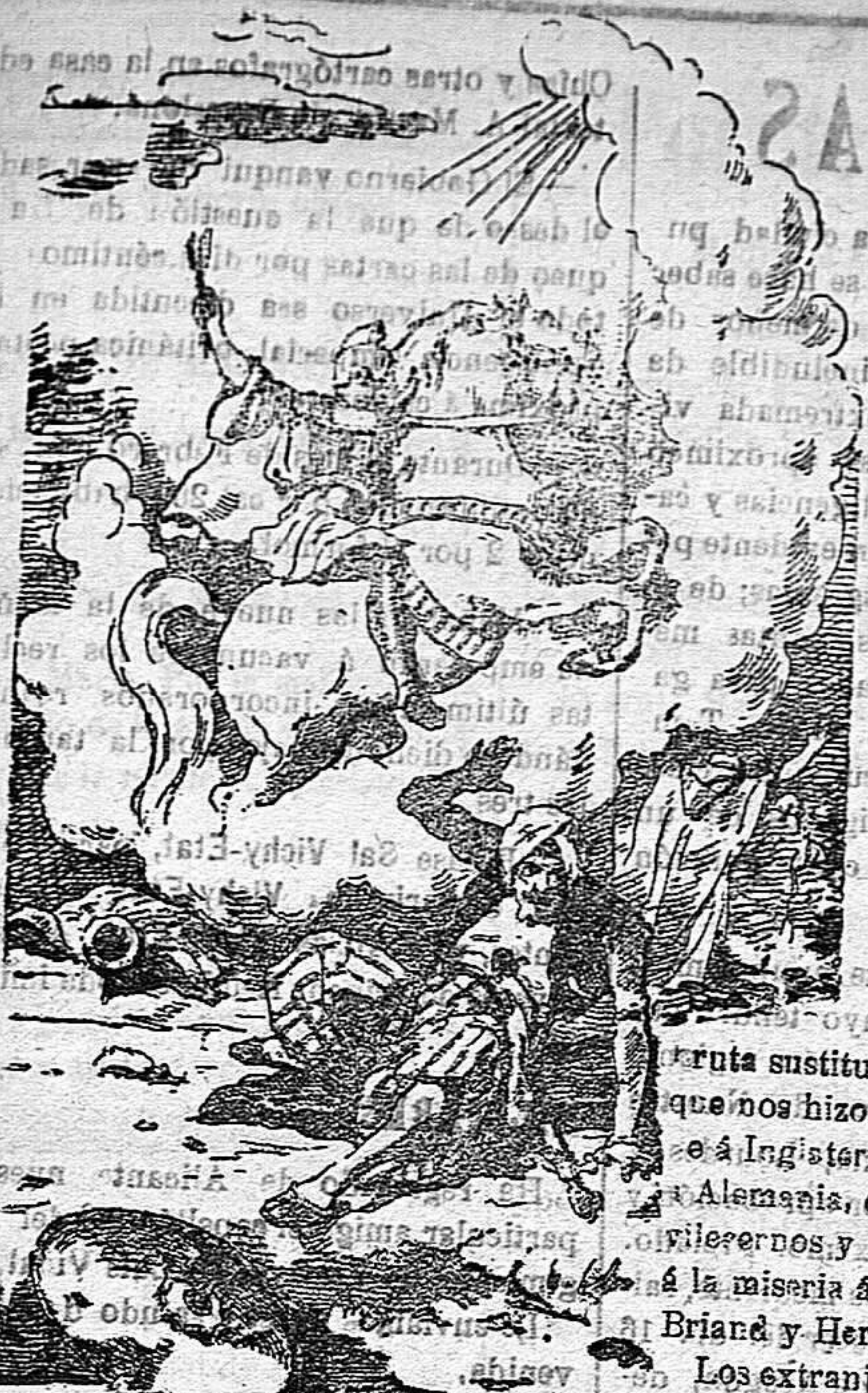
Juicio Mártir San Jorge

Frecios de suscripción Año al mes... 1.50 Ptas. Para los obreros al mes... 0.75 Ptas. Fuera al trimestre... 4.50 Ptas. Número atrasado... 0.15 Ptas.