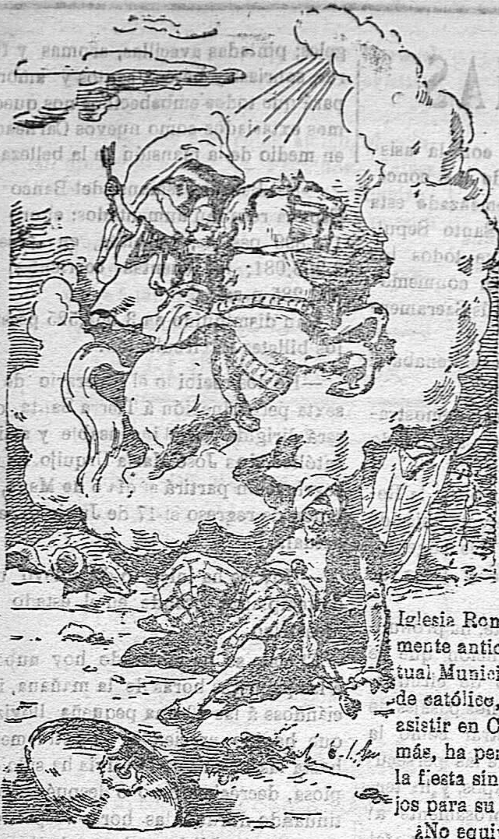
¡Juicio Mártir San Jorge! Defiende al pueblo de Dios

Redacción y Administración Calle Pintor Casanova N.º 24