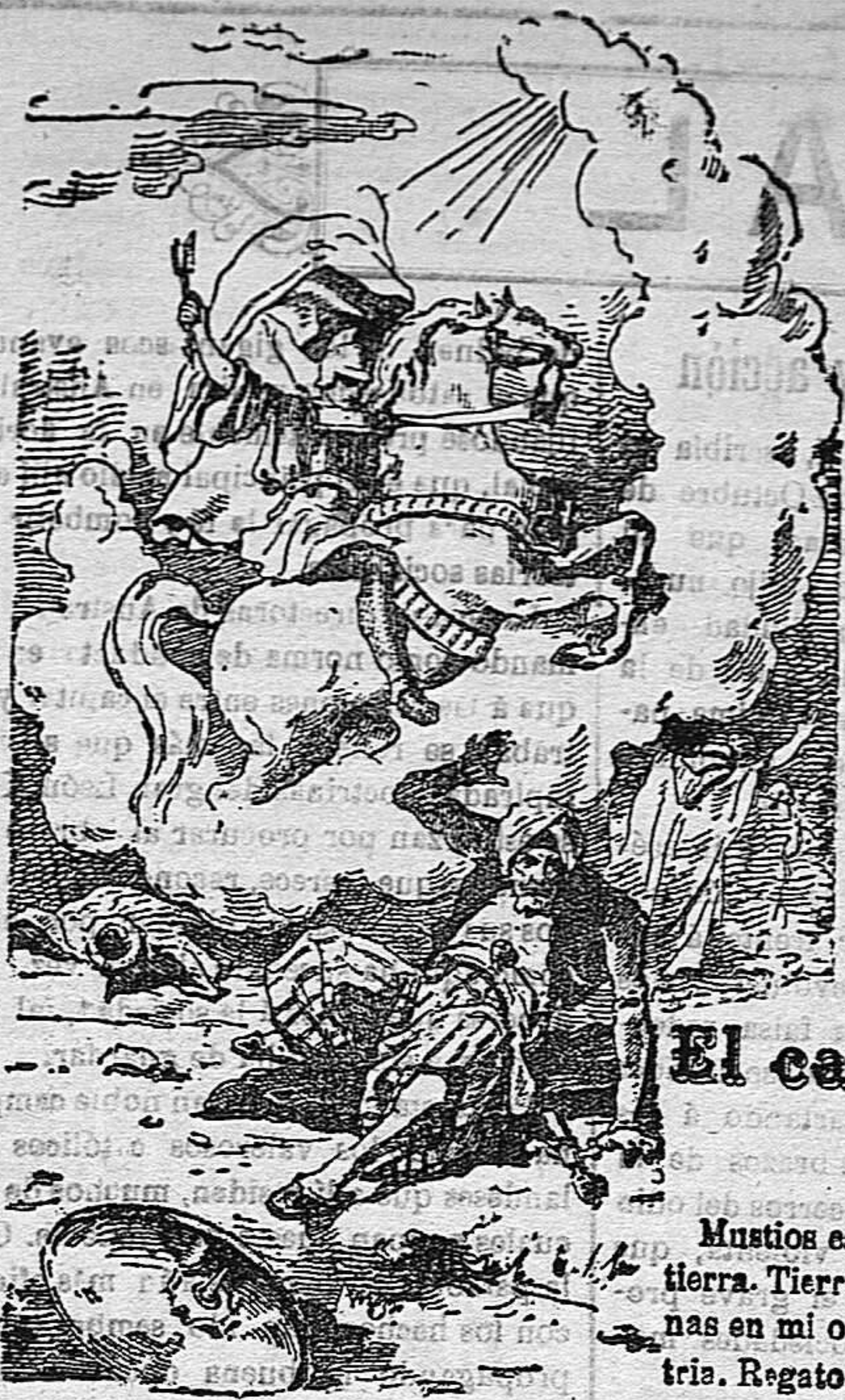
¡Victo Mártir San Jorge! Defiende al pueblo de Dios

Precios de suscripción Alcoy al mes . . . . . 1'50 Ptas. Para los obreros al mes . . . . . 0'75 Ptas. Fuera al trimestre . . . . . 4'50 Ptas. Número atrasado . . . . . 2'15 Ptas.